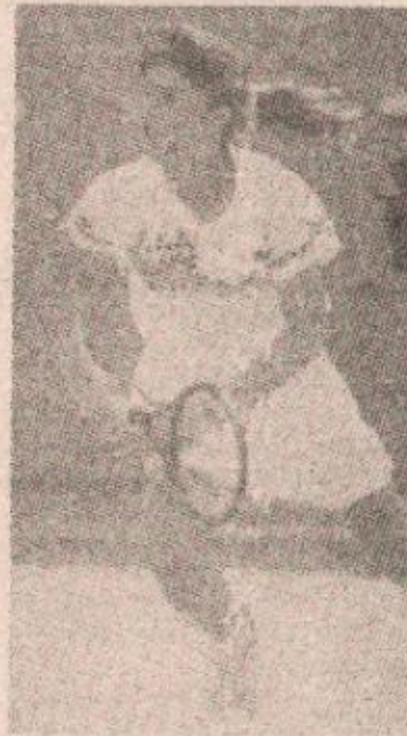
СЕДМА НА ЛИСТИ: Џенифер Капријати

1. Пит Сампрас, САД 3826 бодова, 2. Џим Куријер, САД 3517, 3. Штефан Едберг Шведска 3091, 4. Борис Бекер, гвемачка 2675, 5. Петр Корда, Чешка 2452, 6. Горан Иванчишевић, Хрватска 2294, 7. Андре Агаси, САД 2213, 8. Иван Лендл, САД 2108, 9. Серхи Бругера, Шпанија 1910, 10. Мајкл Чанг, САД 1851, 11. Андреј Медведев, Украјина 1784, 12. Михаел Штих, гвемачка 1751, 13. Рихард Крајчек, Холандија 1624, 14. Карел Новачек, Чешка 1559, 15. Вејн Ференд, Јужна Африка 1546, 16. Маливај Вошингтон, САД 1519, 17. Ги Форже, Француска 1486, 18. Томас Мустер, Аустрија 1485, 19. Хенрик Холм, Шведска 1388, 20. Александар Волков, Русија 1309, итд.