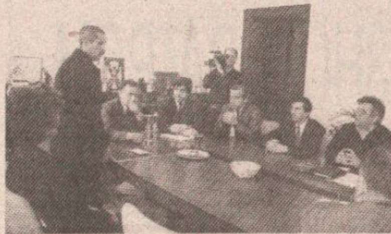
Са пријема у Скупштини општине Бања Лука

Захваљујући разумијевању мојих колега и старјешина из јединице успио сам да за 18. и по сати претрчим 252 километра од Бање Луке до Книна. Они су ми омогућили да се припремам и само у ка-