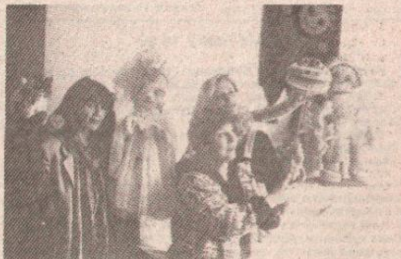
Луткари на дјелу: Из кројачке раднице, гдје се припремају лутке