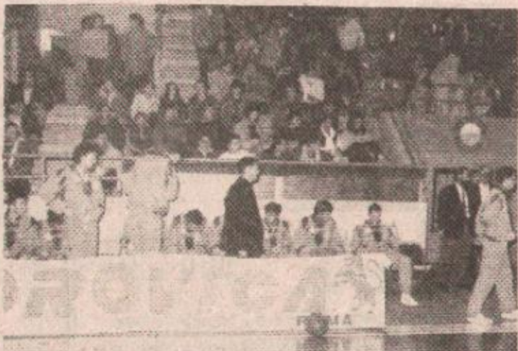
ПРИВРЕМЕНИ РАСТАНАК: Екипа Борца Боровице.