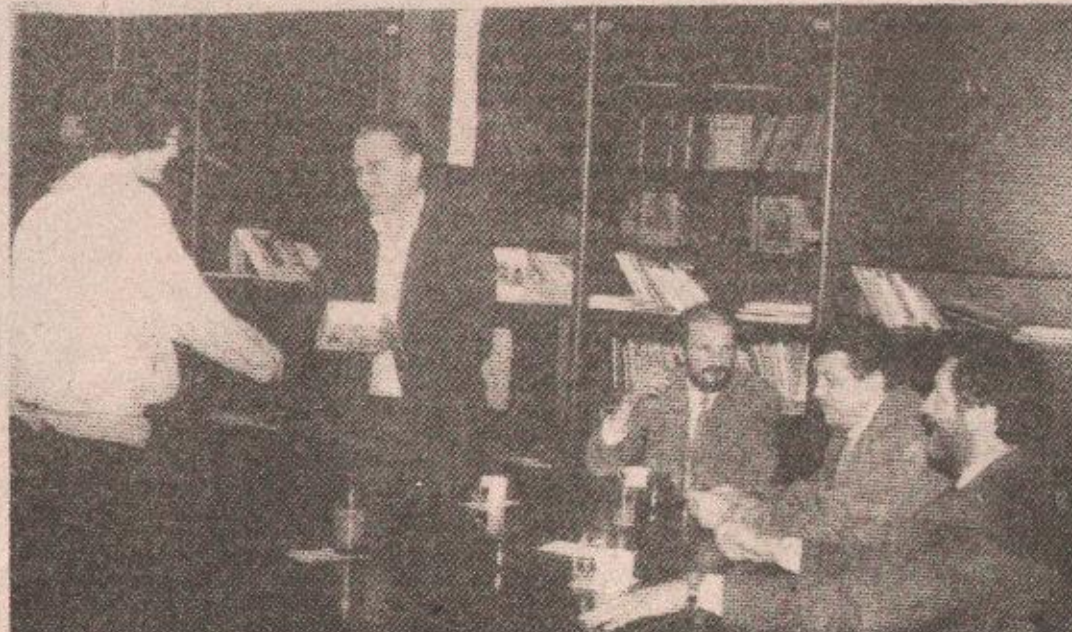
Са пријема у „Гласу“