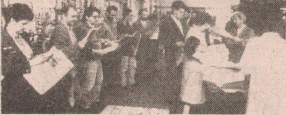
Ротација „Гласа“: Коридор је пробијен

У „Коридору 7“, између осталог доноси се лични став Рајка Петрова Ного о српском питању, под насловом „Са словенским морем у позадини“, као и текст Драгоша Калајића о новом свјетском поретку