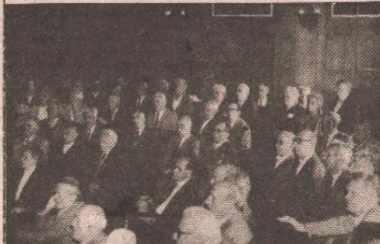
Са свечане академије

• У организацији Општинског одбора СУБНОР-а у Вијећници Дома културе одржана академија поводом 9. маја. Дана побједе над фашизмом