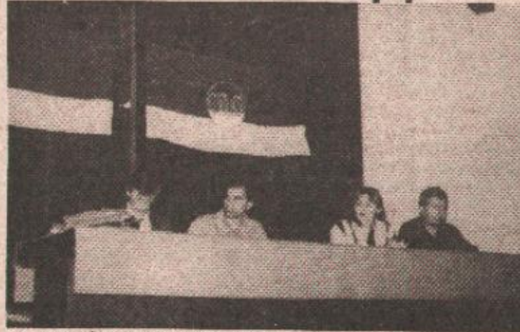
Челници Главног одбора СПАС-а