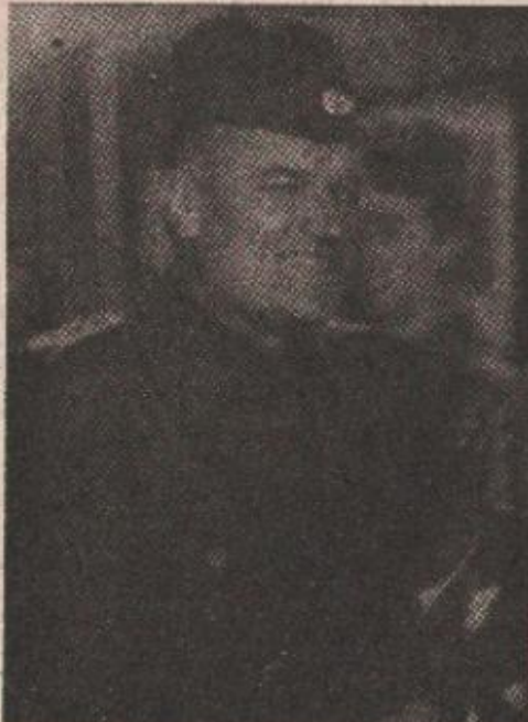
Генерал Ратко Младић: Срби више неће дозволити да их раздвајају ни симболи, ни обилежја, ни циљеви, па ни било чије мале

ку су донијели легитимни представници народне воље и она је, према томе, исправна и не може се оспоравати. „Главништаб Војске РС спроводиће сваку одлуку коју донесе политичко руководство и Скупштина“.