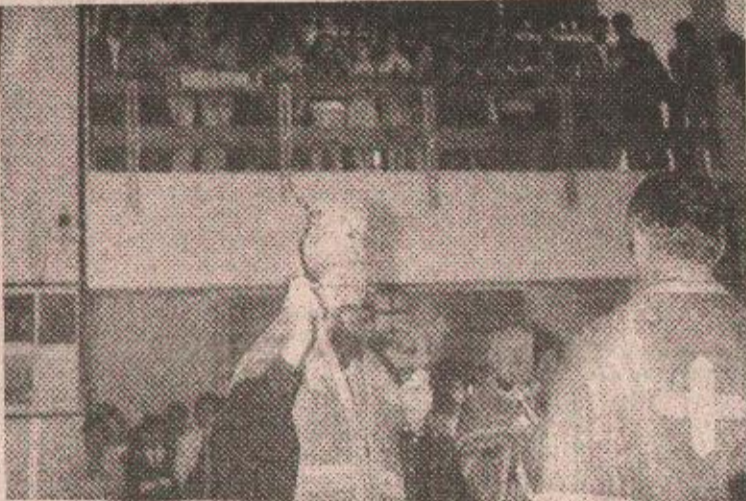
Са свечаности у Основној школи „Свети Сава“