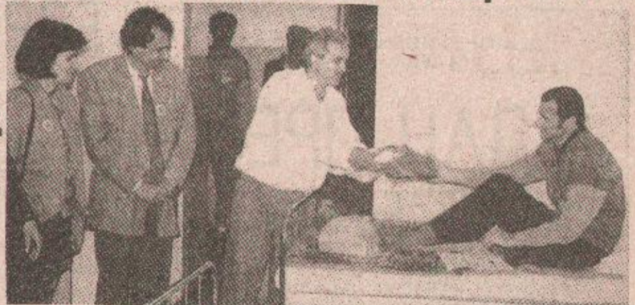
Хуманисти предају поклоне рањеном борцу

Чланови Регионалне организације Црвеног крста Крајине - Бања Лука и делегација Међународног Црвеног крста посетили рањене борце смјештене у Рехабилитационом центру „Др Мирослав Зотовић“ у Бањој Луци Помоћ МКЦК Рехабилитационом центру „Др Мирослав Зотовић“ у ортопедским помагалима требало би ускоро да стигне