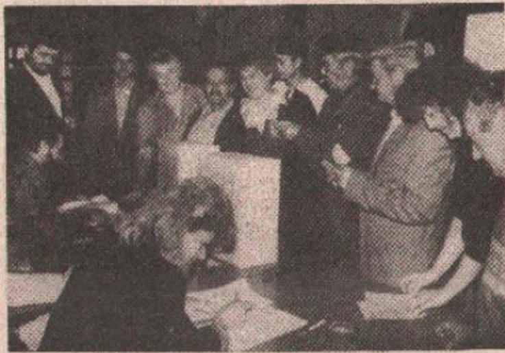
Уз осмијех НЕ Венс-Овеновом плану