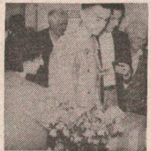
Мејдан: Ред се формирао од разних ју-тарњих свтн