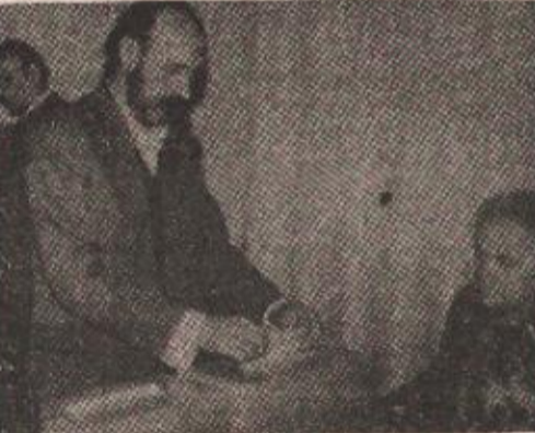
Гласачко мјесто у Мјесној заједници Борик 1 јуче у 7 сати