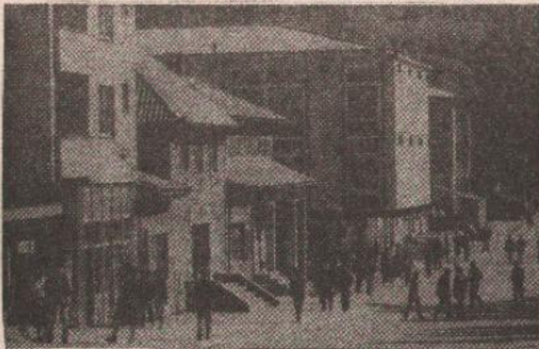
Кнежево: једнодушно за Републику Српску

ГРАЂАНИ КНЕЖЕВА МАСОВНО НА ГЛАСАЧКИМ МЈЕСТИМА