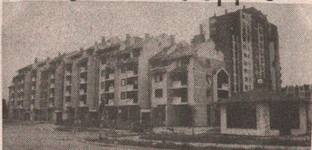
Модрича: Трагови рата свуда видљиви

Као и Брод, Шамац и Дервента и Модрича је прије рата била српски град, јер је овдје већинско српско становништво и сви би се Срби старосједиоци морали, у случа-