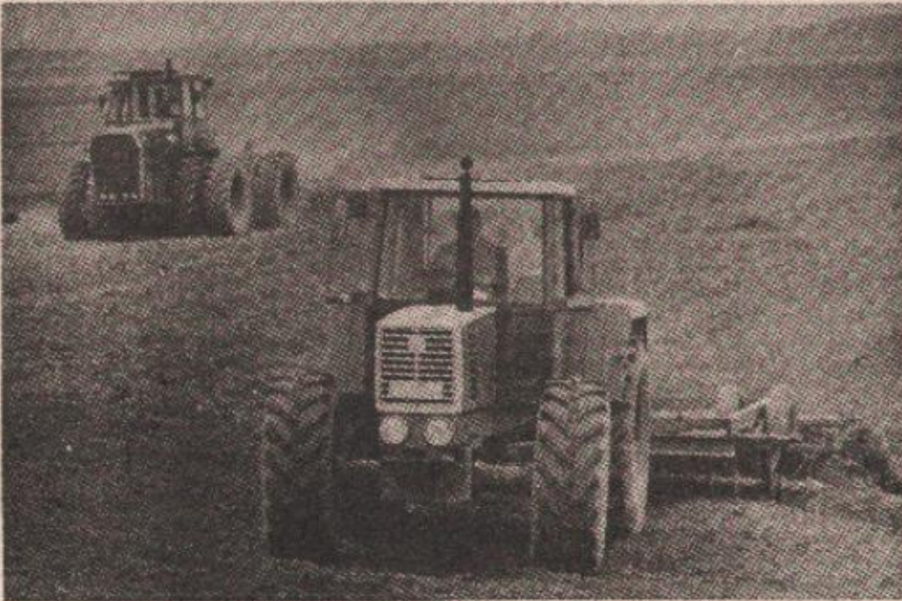
Овог прољећа све плодне србачке парцеле под усјетима

• Ратари „Мотајице“ до сада су засијали више од 500 хектара кукуруза, 250 хектара сунцокрета и 100 хектара соје, што је више од 70 одсто од планираних сјетвених површина • И на приватним посједима приводе се крају прољетни пољопривредни радови