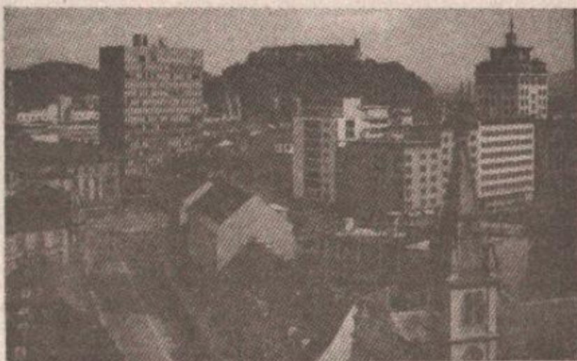
Љубљана — куда иде Словенија?

По повратку са „историјске турнеје по Пентагону“ Јанша се јавно хвалио како су се Американци чудом чудили како му је успјело да тек