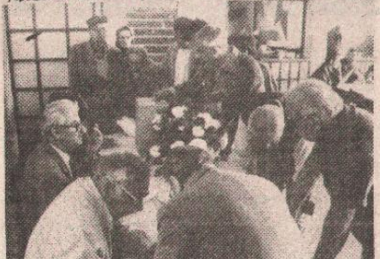
Бирачко мјесто бр. 1: Гуњава око гласачке кутије