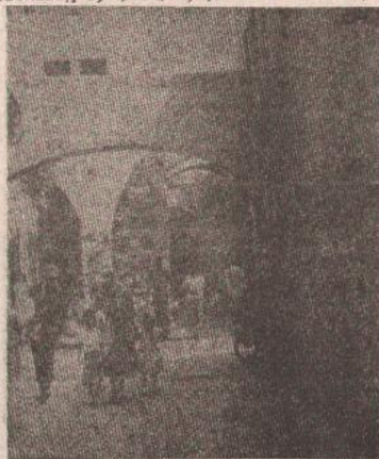
Јерусалим: трчање у мјесту

У блискоисточној мировној иницијативи „лопта је враћена на центар“, њени учесници обећавају „у принципу“ да ће наставити пре-