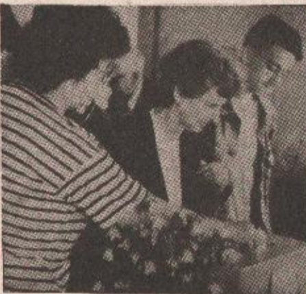
Са биралишта у Мејдану - Бања Лука

Званични резултати референдума биће познати сутра у 15 часова, када почиње засједање Народне скупштине Републике Српске. Комисија за провођење референдума поднијеће