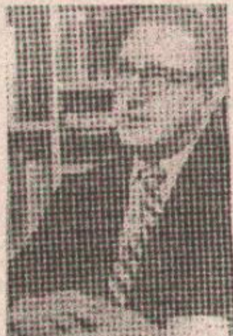
Хенри Кисинџер. Можда нова улога

Америчка средства информисања у посљедњих неколико дана дала су знатан публицитет Караџићевим изјавама. Примјећује се да се „српска страна“ пробила на странице листова и ТВ-екрана нешто више него раније и да је, нарочито последице разбукутања борби између Хрвата и муслимана, у америчком медијском простору дошло до малог, али примјетног помака у третирању Срба. Данас је, на примјер, мрежа ЦНН, до сада израито антисрпски настројена, неколико пута емитовала филмску репортажу Кристијана Аманпура из једног српског села у источној Босни са потресним сликама сахрањивања Срба које су масакрирали муслимани. Водитељ је репортажу почео рјечима: До сада су Срби ис-