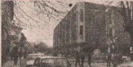
Новљани јединодушни у одлуци за самосталну РС

ХЕРЦЕГ НОВИ, 18. маја (Танјуг) — На референдуму за изјашњавање избјеглица из бивше Босне и Херцеговине о Венс-Овеновом плану, синоћ су, у 20 часова, на гласачком мјесту у Игалу затворене кутије. Укупно је гласало 2.138 бирача, што значи да је одзив био изван очекивања. Одзив раније у Војној болници — „Маљине“ и Институту „Доктор Симо Мишковић“ у Игалу био је стопостотан.