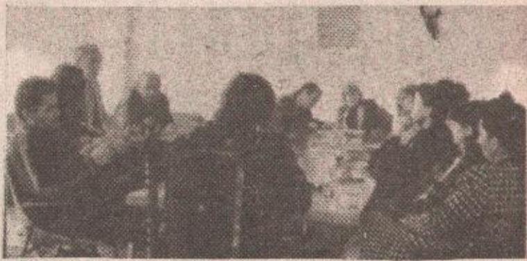
Детаљ са прве, од 17 планираних читаћих проба