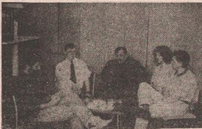
У Редакцији „Гласа српског“ све дефинисано за Книн