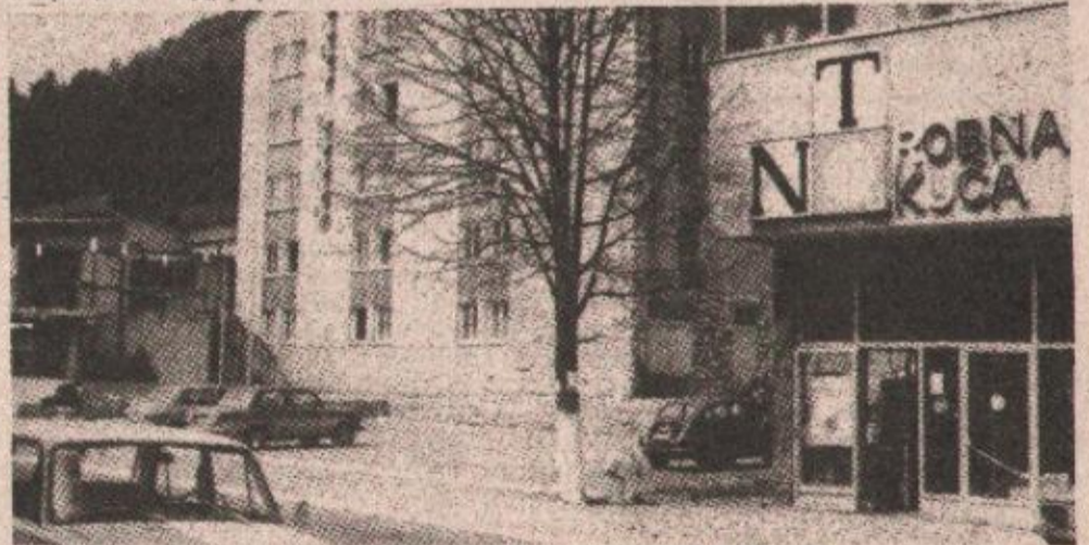
Котор-Варош: Добар одзив на референдуму

За разлику од те двије мјесне заједнице, у Гарићима, са већинским муслиманским становништвом, на референдум је изашло 72 одсто бирача, од којих се 66 одсто изјаснило против плана, а 73 посто за самосталну Репу-