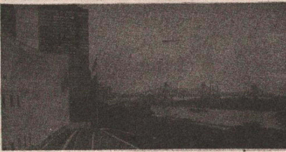
Уједињене нације — шта послје 30. јуна

пажљиво, закључио сам да у овом тренутку Савјету безбједности не препоручим ниједну од њих“ — цитира британска агенција Галија, наводећи такође његове ријечи да „чека извјештај Столтенберга, који је тренутно у регистру“.