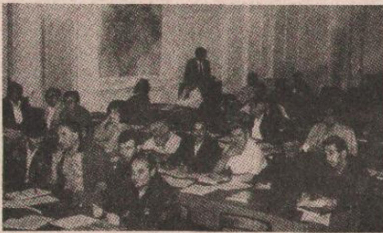
Детаљ са сједнице

Током овог године у Бањој Луци су убијена 34 лица — 13 Срба, 11 Хрвата и 10 муслимана... По основу недозвољене трговине