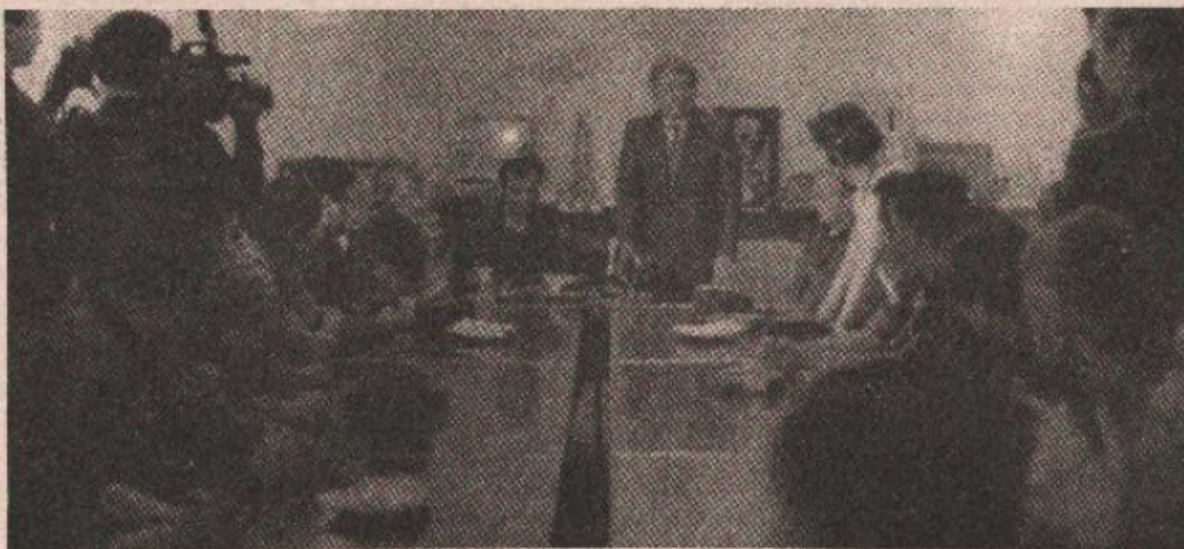
Са свечаног пријема у кабинету Председника општине

— Са љубављу смо вас прихватили, након ваше „одисеје“ од Словеније до Мостара и вјерујем да се осјећате да