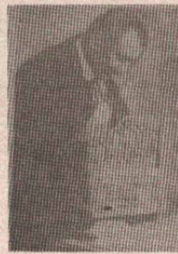
Двадесетог маја 1868. године рођен је Алекса Шантић

Двадесетог маја 1868. рођен је француски писац Алекса Шантић . Написао драме „Под маглом“,