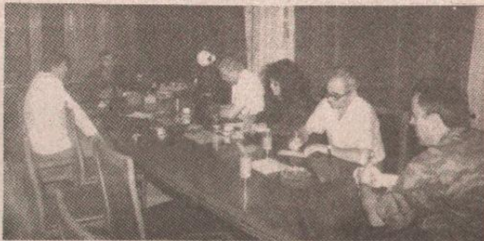
Са данашњег пријема у Команди В и ПВО

Јача од свега је била свест о угрожености свог народа. Јача је била жеља за отпором и свест да се народ мора заштитити и опстати. То је био најјачи мотив. Даставимо нашу струку, наше индивидуалне способности и знања у сасвим организован систем. За ову годину дана оцењујем да смо у томе потпуно успали. На простору Републике Српске је веома брзо заживио