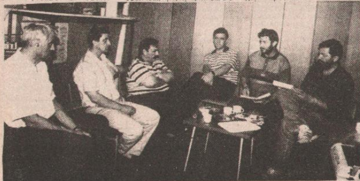
Стара седишница Органizacionог одбора

Протеклом ове фудбалске ревије предвиђено је да објектима у недјељу прије подне посјете рањенике у Заводу „Др Мироста Зетовић“ кли-