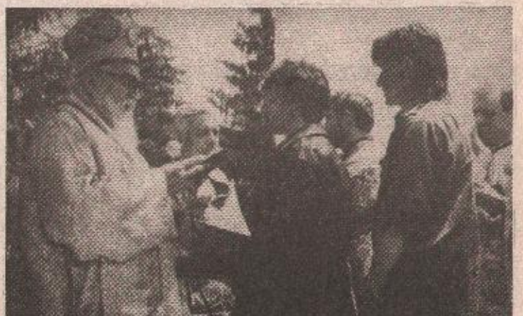
Крштење младих бораца