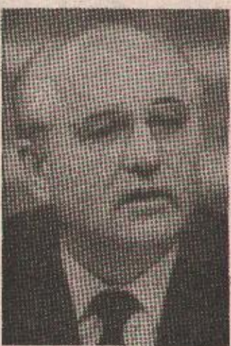
Михаил Горбачов: Међународна заједница стимулисала сепаратизам и национализам

• Умјесто да помогну југословенским народима да сједине за преговарачки сто, западне земље су се упустиле у „сулудо такмичење“ ко ће прије да призна Словенију и Хрватску - рекао је Михаил Горбачов у специјалној емисији канала „Арте“ француске телевизије