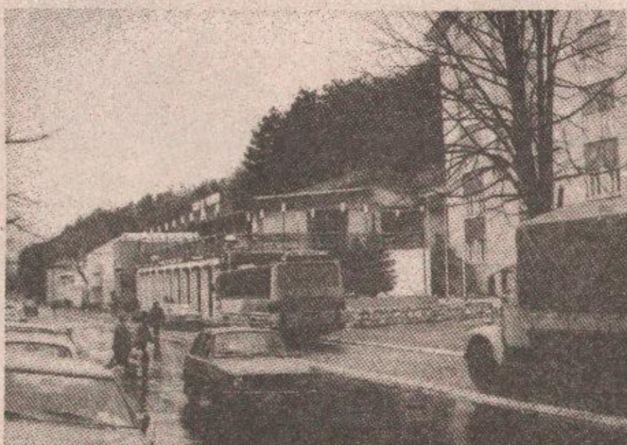
Котор-Варош: Ко је стицао противправну имовинску корист?

Од око 300 тона горива које је у назначеном временском интервалу