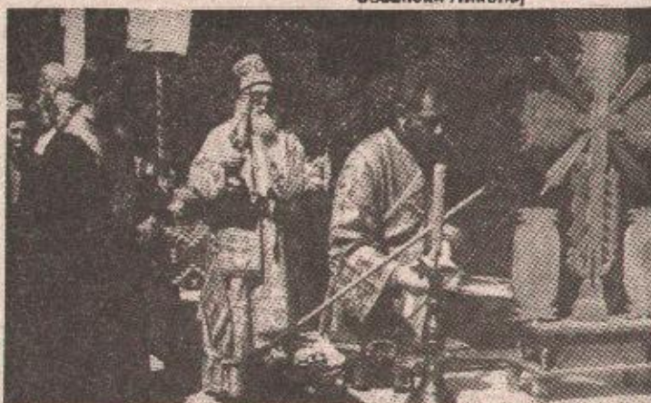
Мирис тамјана уместо мириса барута — детаљ са свете литургије

Јутрос, прије литургије, педесетак бораца са овог