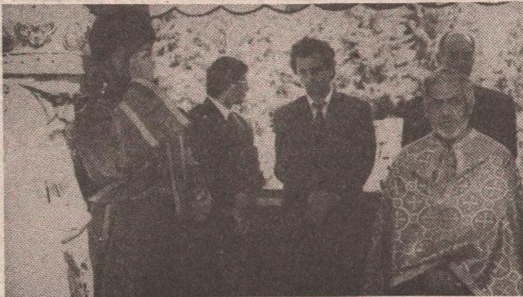
Високи гости на служби Божијој

— Немојте ме звати. Ја ћу у ову епархију доћи поново и без позива. Ту сам, побјећи