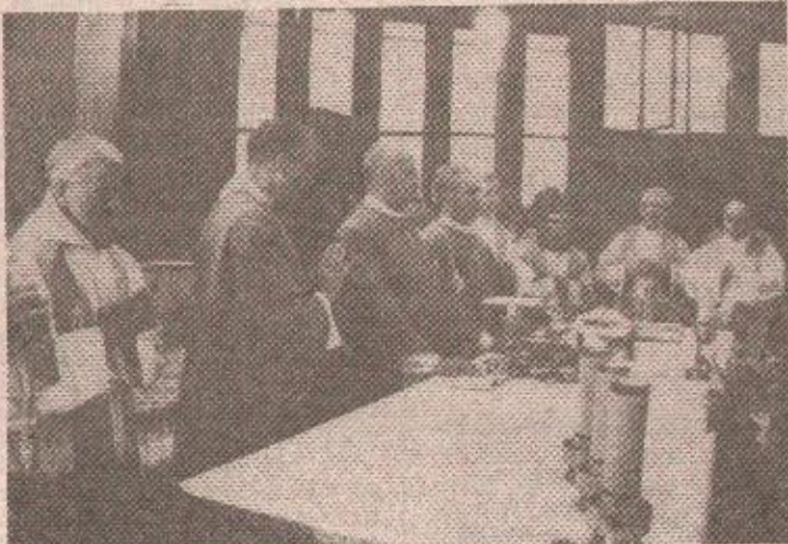
Кардинал Роже Ечегарај служио мису за мир