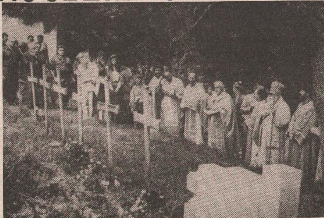
Парастос погинулим српским борцима