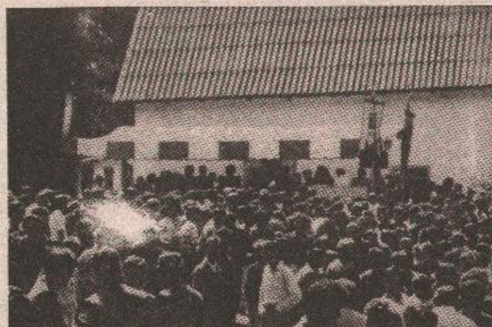
Ово је српска земља — народ пред црквом Светог Илије