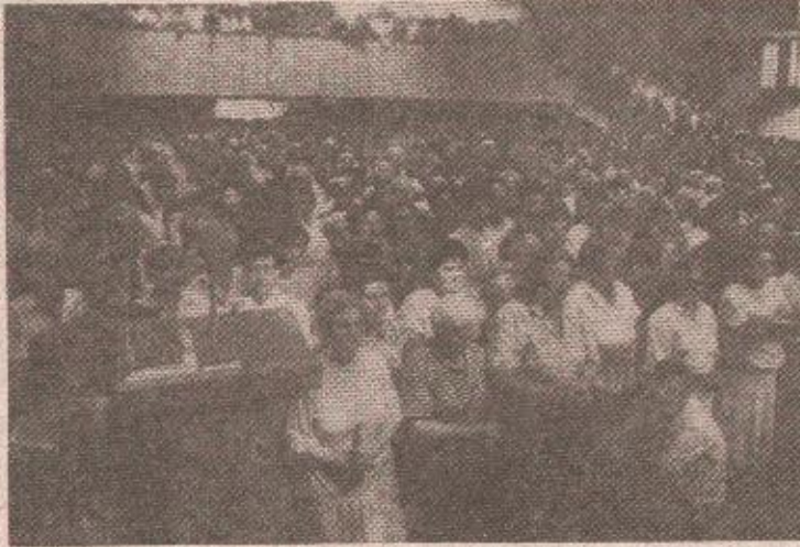
Миси присуствовао велики број вјерника