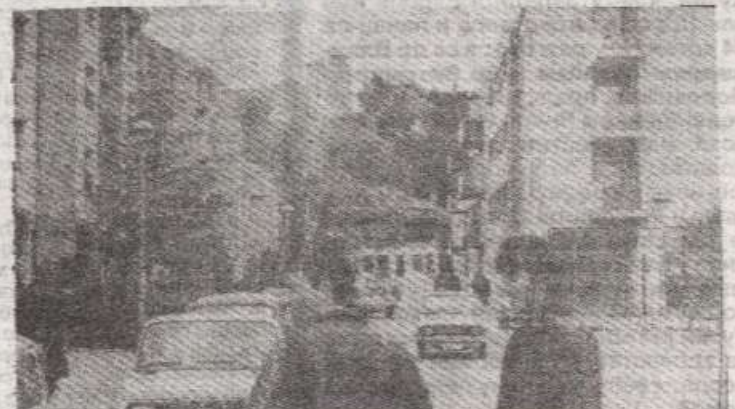
У средишту ратних збивања: Бинковац

КНИН, 8. јуна (Танјуг) — На сјевернодалматинском и личком ратишту настављене су повремене борбе сукобљених страна, саопштио је данас Главни штаб Српске војске Крајине.