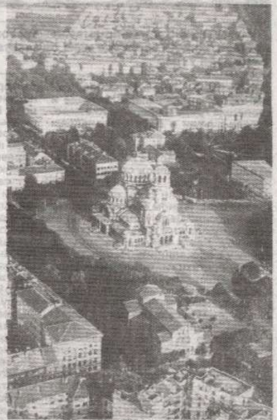
Софија је више очекивала

У Бугарској је велики публицитет дат и обиљежавању празника „Светог духа“, односно такозваног „македонског дана“. Тим поводом у више православних храмова јуче су одржане свечане литургије у спомен на „хероје пале за слободу бугарског народа у вардарској Македонији“, међу којима се набрајају Гоце Делчев, Даме Груев, Тодор Александров, Влада Черномоземски, Мара Бунева и други. У граду Санданшки, уз учешће више народних посланика, одржан је велики митинг на којем је речено да је „само у вардарском дијелу Македоније“, од 1944. До