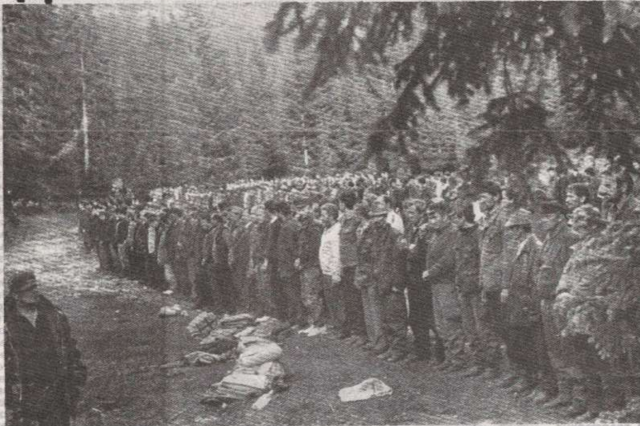
Припадници травничког ХВО на Влашићу после предаје оружја Војсци Републике Српске

ВЛАШИЋ, 8. јуна — Харамбашине воде на Влашићу привремено су станиште око осам хиљада Хрвата избјеглих из Травника пред терором и злочинима муџахедина и припадника других оружаних муслиманских формација. Преглашени терором у мјестима живљења полако се опорављају, срећују утиске и документовано причају о зподјелима каква су ријетко забиљежена.