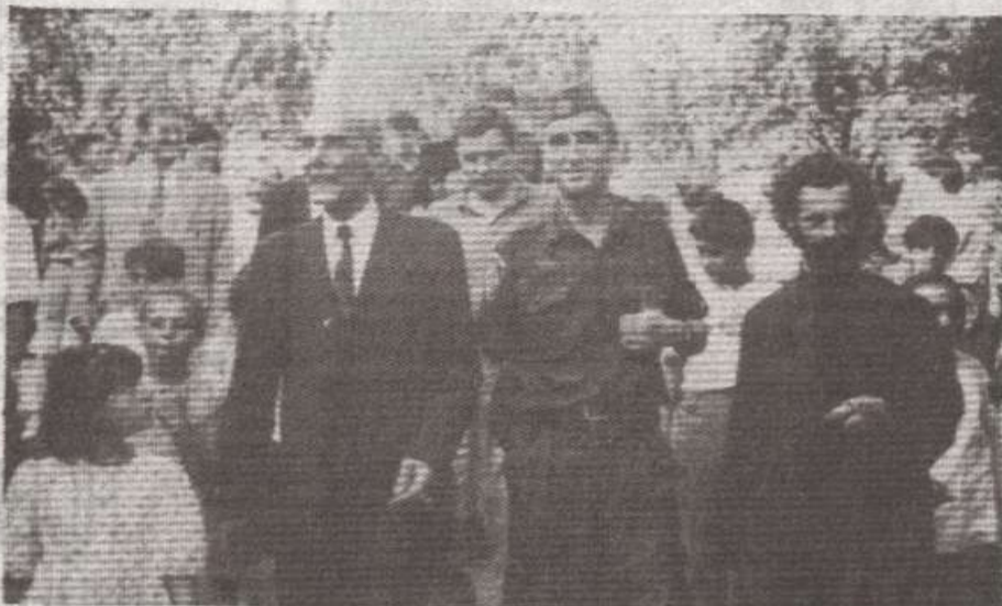
Шетња предграђем Гавринци

вање Принца, по овдашњим обичајима, пешкиром. Након доксологије, односно краће молитве у цркви, уобичајене приликом доласка изузетних гостију, Принц је с пратњом кренуо према Пакрацу. На путу до овог мјеста, у којем се већ стотинама година налази сједиште Српске епископије, високи гост је прошао кроз окучанска и пакрачка села Цаге, Бенковац, Трнаковац, Доњи Чаглић, Буковчане, Јапагу и Шеовицу.