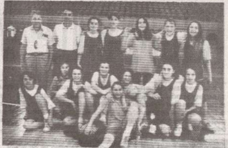
ДВА ПОРАЗА: Старије пионирке ОШ „Вук Караџић“