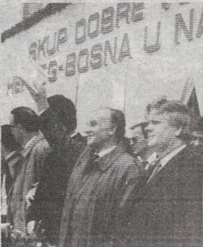
Некад било: Митинг СДА Бања Лука 22. априла 1991.

ије, прихватањем и спровођењем Венс-Овеновог плана, конституисању Бихаћке провинције на четири општине које они држе, а шире замишљено оставити за послје када за то буде вријеме. плану петорице министара иностраних послова велесила и резолуцији Савјета безбједности УН 836 о безбједносним зонама као прелазним рјешењима за окончање рата и кризе, рекао је својим Крајишницима Њихов Бабо.