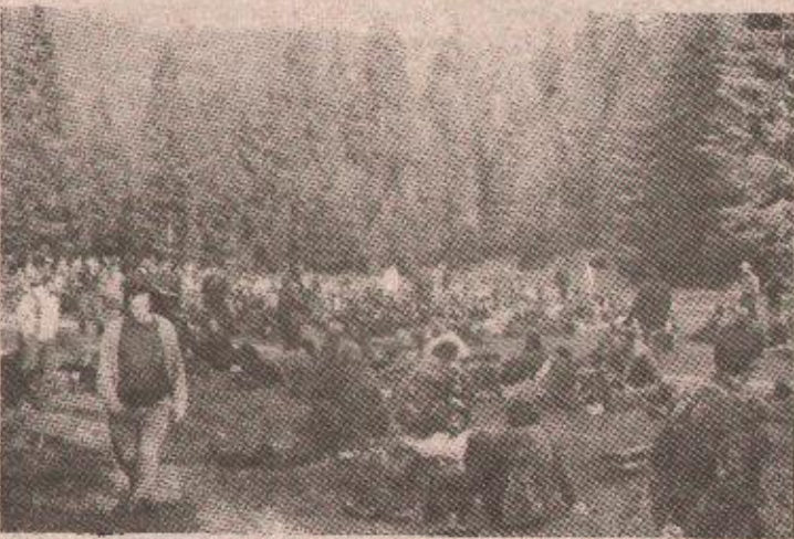
Избјеглице из Травника прије поласка са Влашића

нике из Травника. Тада службеници Министарства здравља, припадници Центра служби безбједности Бања Лука и мисионари бањолучке Канцеларије Међународног Црвеног крста ступају у акцију, како би