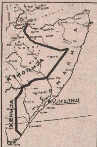
Сомалија, растрзана унутрашњим тврдњама, сада и под ударом из ваздуха

Амерички званичници тврде да садашња операција нема никакав временски лимит и да ће трајати све док се не остваре постављени циљеви