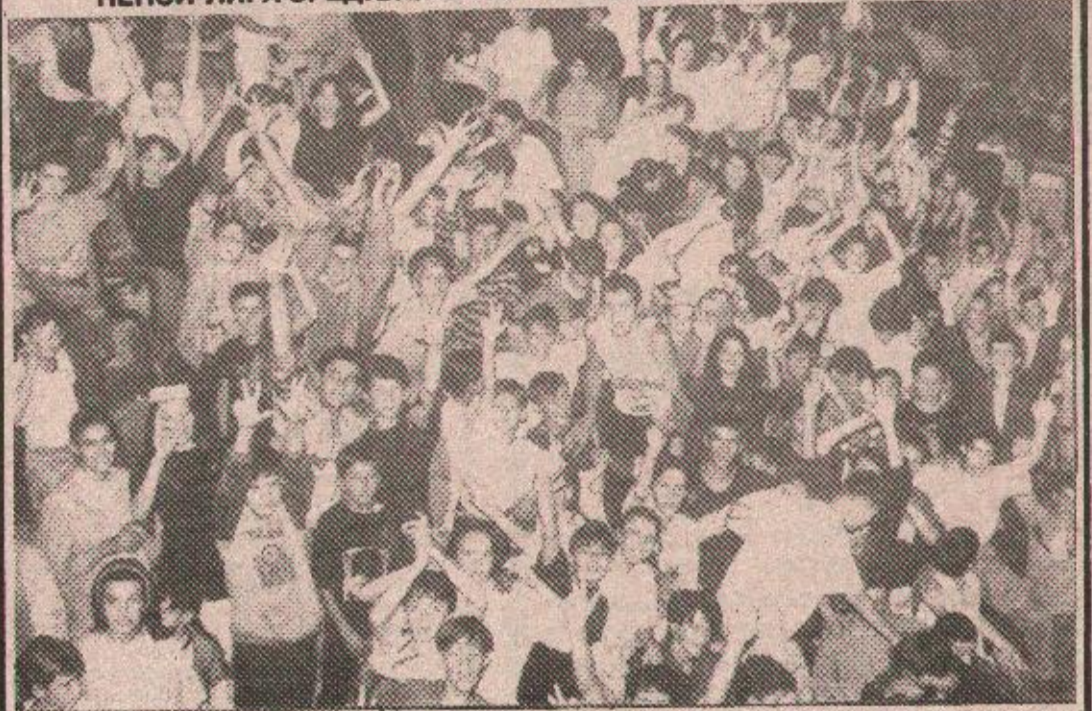
Срчани навијачи, ученици, родитељи и такмичари: све под једним кровом, прави спортски доживљај

ПЕПСИ-ЛИГА СРЕДЊИХ ШКОЛА У РУКОМЕТУ У СД „БОРИК“