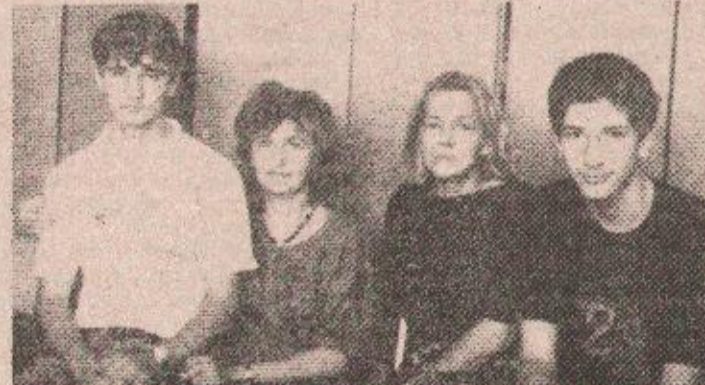
АМБИЦИЈЕ: Најбољи појединци и педагози ОШ „П. П. Ђеђош“ ипак обављају финале

Треба истаћи да су најватренији и најсрпанији навијачи управо педагози-трениери школе „П. П. Ђеђош“.