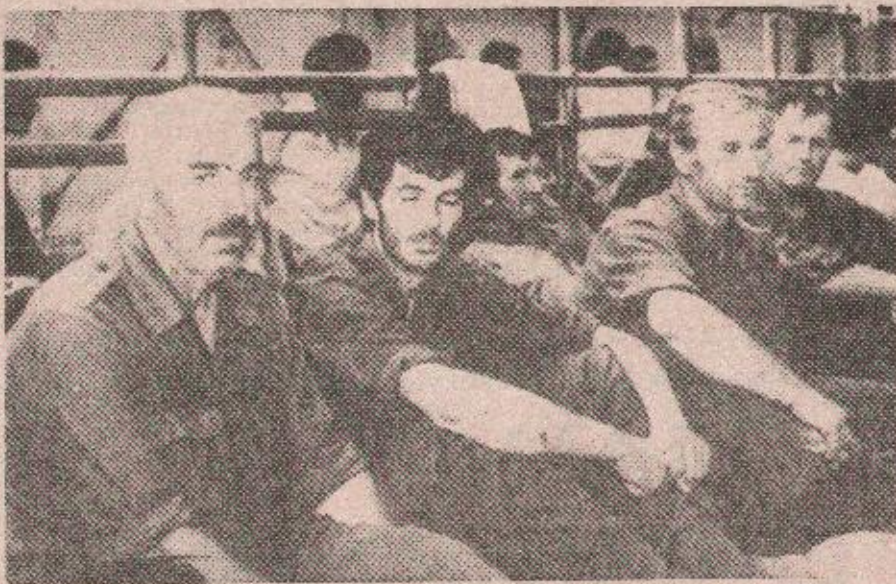
Ријечи избјеглица: Све су закухали Венс и Овен са својим мапама