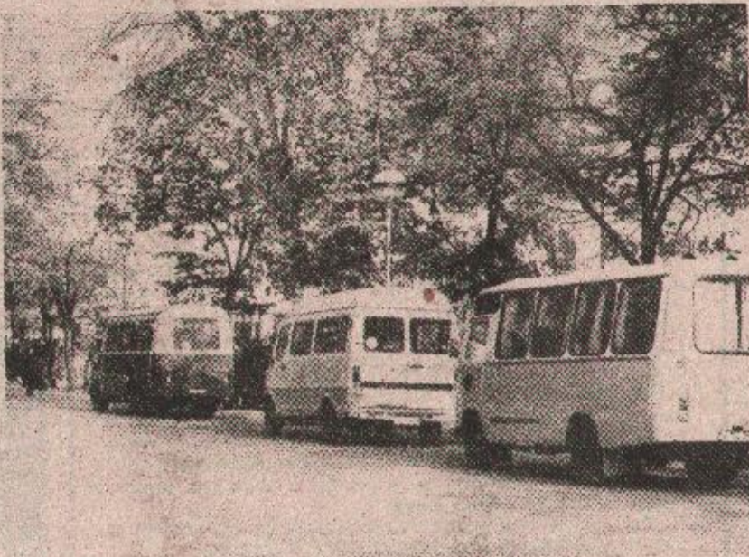
Било како или никако: комбији бањолучких приватних превозника

Разлог пошим услугама приватника и њиховом самовољном