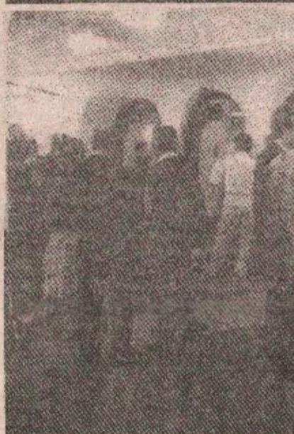
Детаљ са изложбе