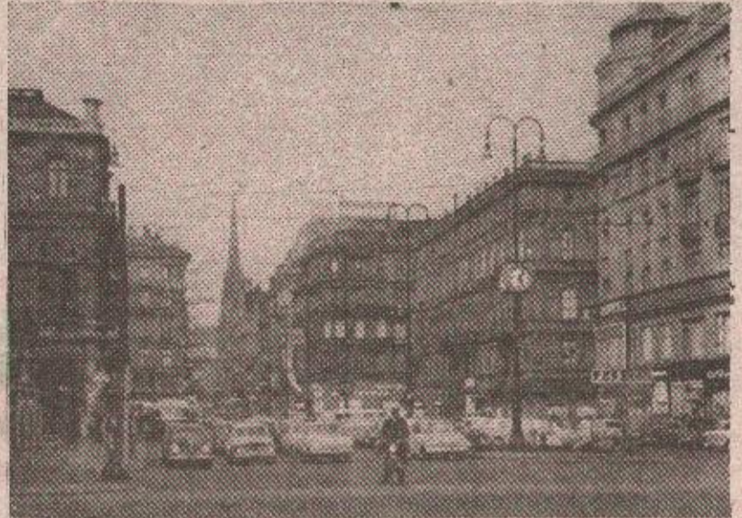
Беч — више „бриге“ о туђим него о својим мањинама

Он је конкретно указао на чињеницу да још није ријешено питање таблица са двојезичним називима мјеста у којима живи мешовито становништво, на