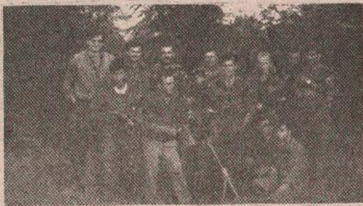
ОДЈЕЉЕЊЕ ЗА ПОДРШКУ ЦСБ-А КРАЈ МИНОБАЦАЧА М-82 ММ

— Баш смо прије неки дан добили дојаву да су се у