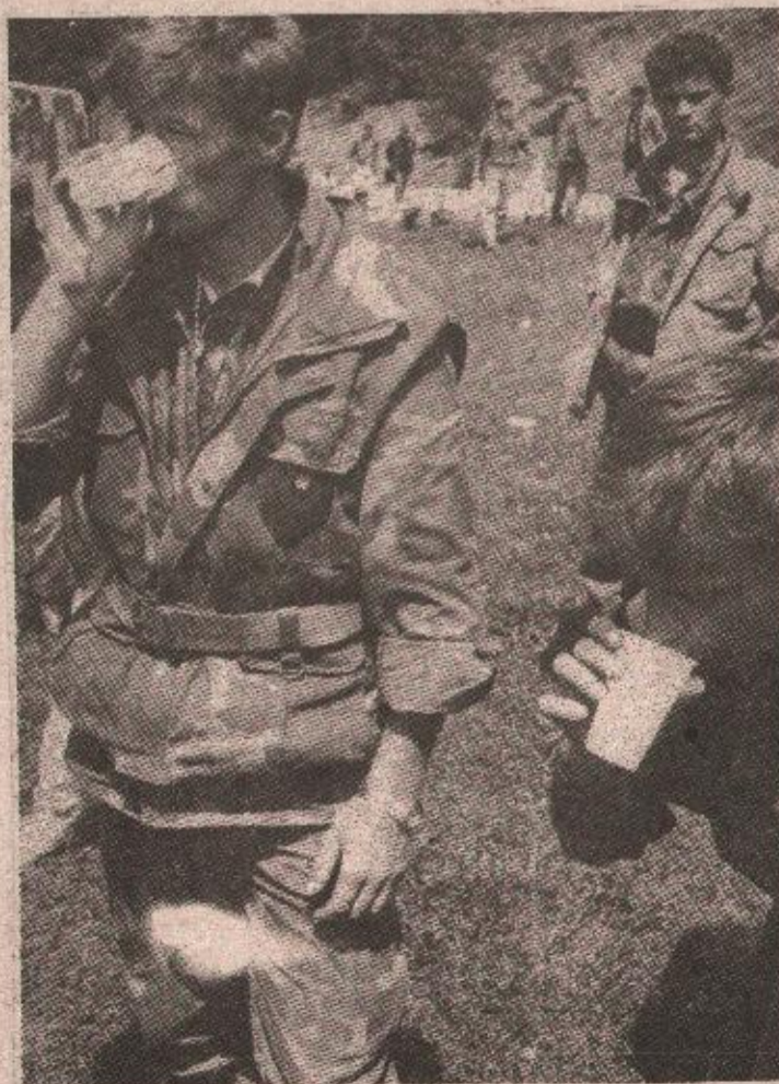
Вода најтраженији напитај: Припадници ХВО по доласку на српску територију

У некој новој државној заједници можемо прихватити само суживот са Србима, док