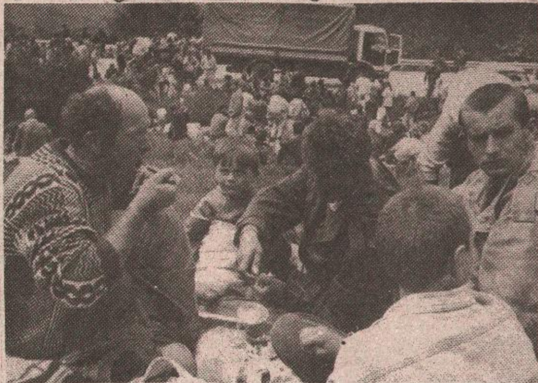
Хвала Србима: Ручак стиже редовно