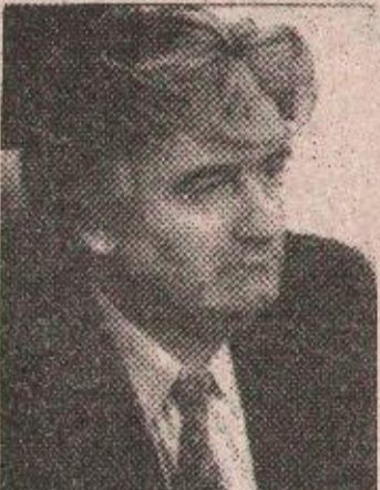
Др Радован Карацић: Мирни процес је кренуо

поса страна инсистира најприје да се обустави рат. Затим да се дође до разумног разграничења и потом одре-