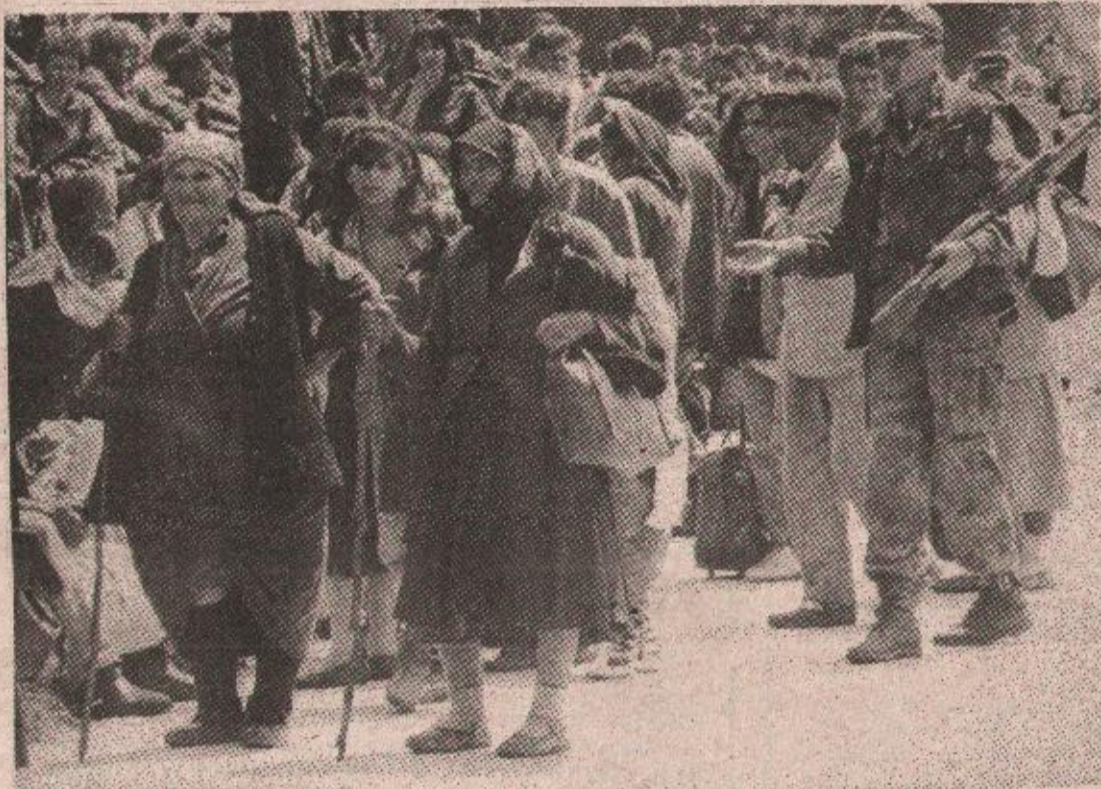
Кудан заило? Хрватске избјеглице у Марковцу