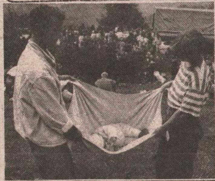
Кад нема кревета, може и овако: Најмлађа избјеглица из Новог Травника