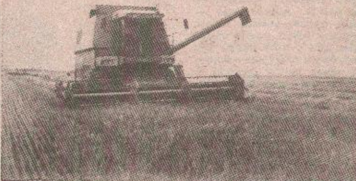
Комбајн ПД „Младен Стојановић“ на жетви јечма код Нове Тополе

У оба сектора пољопривреде има довољно комбајна, а заједнички проблем је недостатак резервних дијелова, као и недовољан број комбајнера. Стога се очекује да ће, бар за вријеме жетве