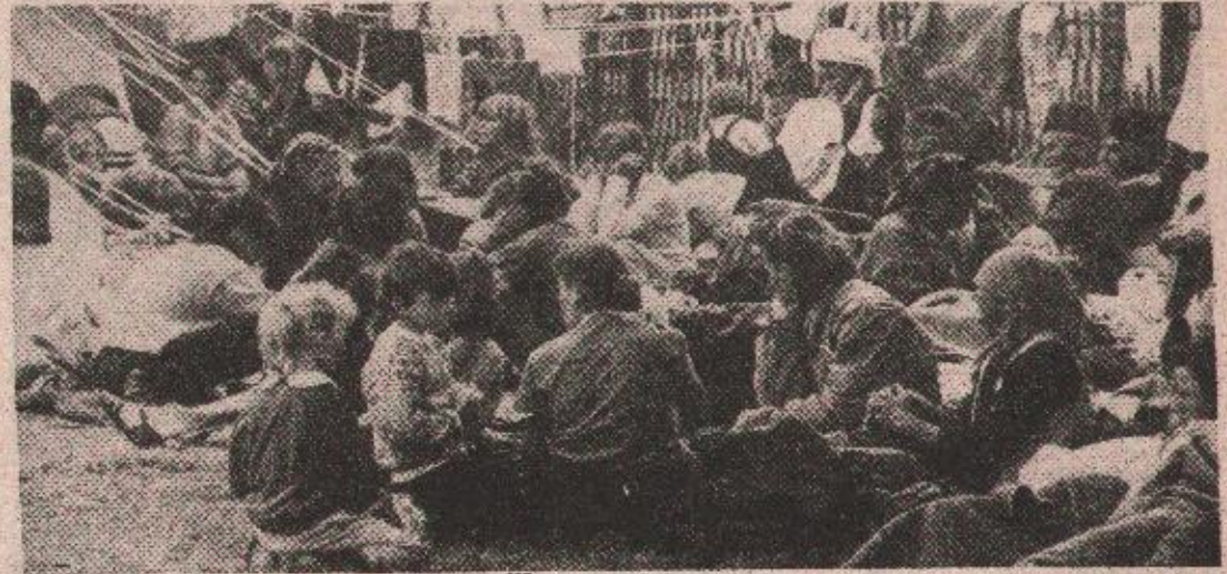
Жртве лажне коалиције

● Вјерујући празним обећањима Алије Изетбеговића и његових истомислџеника руководство Херцег-Босне довело је хрватски народ у веома тежак и неизвјестан положај ● Успјешним акцијама муслиманских и муџахединских снага у лашванској долини довело је до готовог пораза снага ХВО у том региону и масовног egzодуса хрватског живља ● Ефектна и брза пobjеда муслиманских снага остварена је уз масовне покоље, паљевине и рушење свих објеката који су припадали хрватском и српском живљу и култури