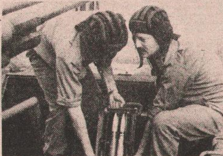
„Кад видимо шта се ради не иде нам се у Бању Луку“ — тенкисти спремни за акцију

— Докле ће све то тако бити? Борци пријете да ће Бања Лука бити град великог обрачуна. Кад дођемо и видимо шта се ради, нама се у Бању Луку не иде, али морамо да видимо своје породице.