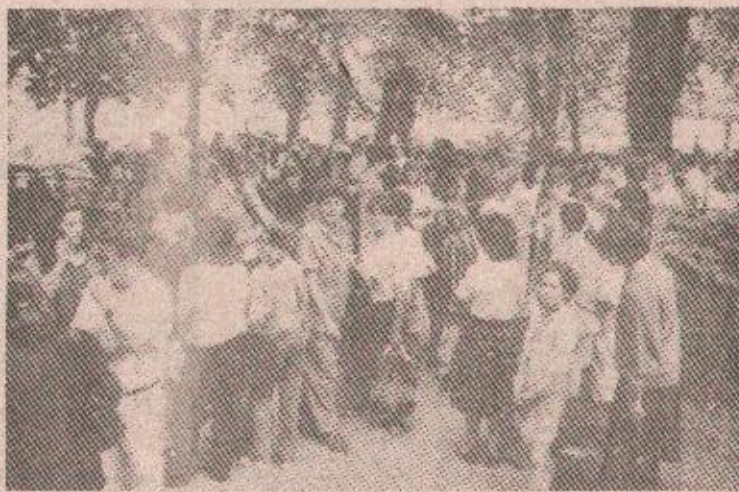
За многе малишане ово је први одлазак на море