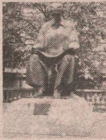
Генију дарована и спомен-књига

У Токију се, иначе, за 25. јун припрема скуп о Николи Тесли, у организацији једног од највећих