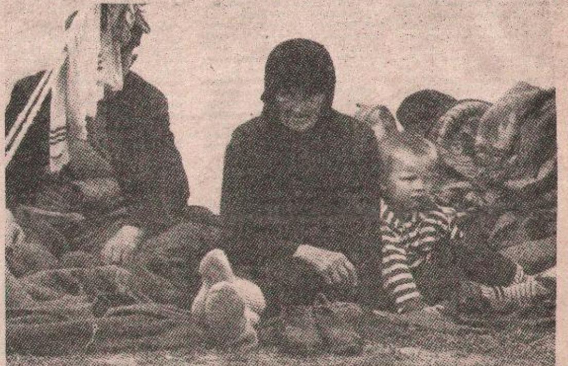
Иза њих су остали срушени објекти и попаљена села

наредном периоду, уколико ХВО не буде у могућности да заустави офанзиву муслиманских снага, оне ће своја дејства усмјерити на Горњи Вакуф и Бугојно, чиме ће се створити оперативна основица за заузимање и потпуну контролу долине Неретве.