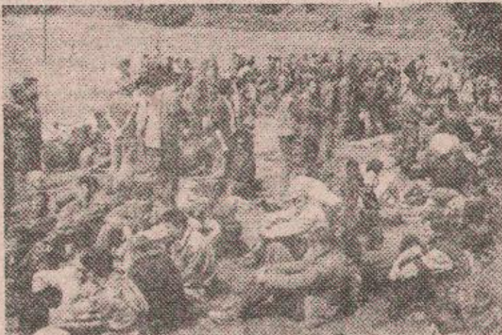
Припадници ХВО послије предаје оружја српским борцима

захтјева за живот муслимана, принуђујући их свакодневно по неколико пута да се моле и клањају богу. Истовремено, у бројним логорима широм бивше БиХ муџахедини су протеклих мјесеци учествовали у обуци муслиманских снага за одлучну одбрану „исламске земље“. У исто вријеме, муслимански руководиоци непрекидно су пред свјетом и међународним форумима оптуживали Србе за геноцид, етничка чишћења и агресију на муслиманске територије у чему су захваљујући снази исламског капитала имали, посебно, подршку кругова у САД.