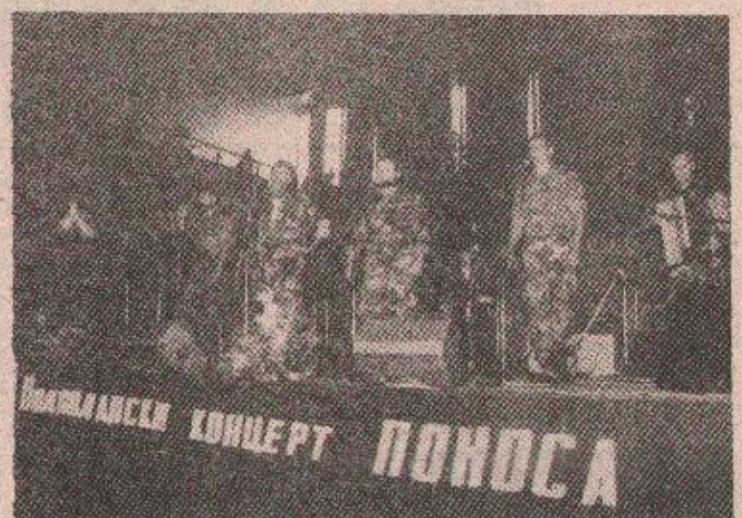
„Јандрино јато“ из Кинна

Гости из Кинна, чланови ансамбла „Јандрино јато“ представили су народни мелос са крајишког, завичајног поднебља. док је Културно-оперативна група 43. приједорске моторизо-