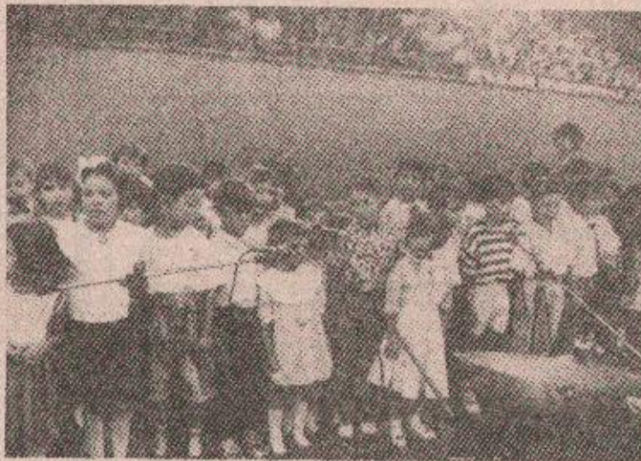
Малишани из бањолучког вртића „Боса Ступар“