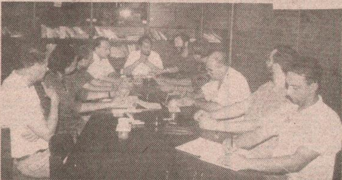
Са конференције за новинаре у „Гласу“