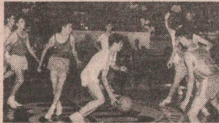
Јакирић (ОШ „Бранко Попић”) у акцији