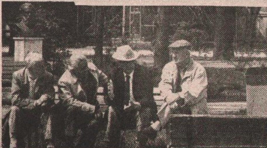
Како изгледа новчаница од милион динара: Група бањолучких пензионера

људи жељно ишчекивали паре. Речено им је да се новац неће дијелити прије понедељка, јер „забога, имам товар писма подијелити“. „Чекајте ме испред мјесне заједнице, па кад дођем, не знам у колико сати, добићете паре. Ко ме буде чекао код куће, донијећу му кад стигнем, рекао је поштар пензионерима у Мејдану, у прошли петак.