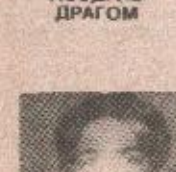
ОГЊЕНУ (УРОША) КРЕПИ

Од маминих колегица и колега из поште. Колектив предузећа ПТТ „КРАЈИНА“ Бања Лука