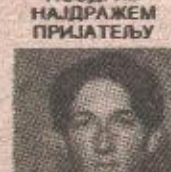
ОГЊЕНУ ОГИЈУ КРЕПИ