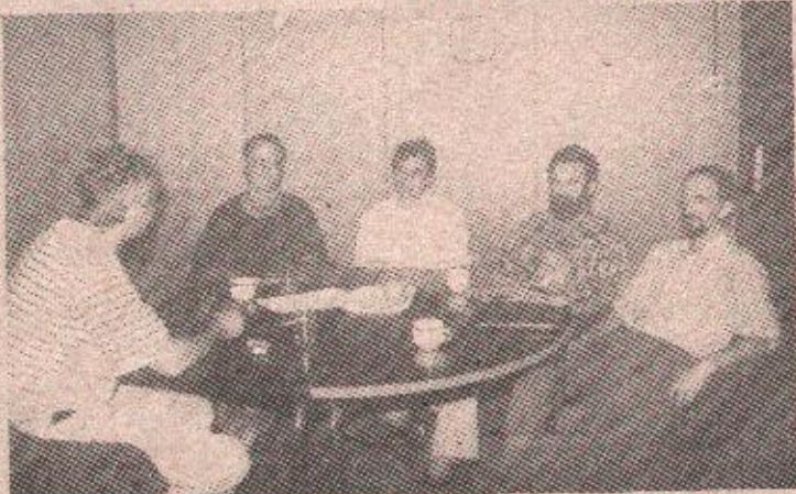
Разговор у редакцији нашег листа

ПРЕДСТАВНИЦИ КЛУБА ОДБОРНИКА СДС ПОСЈЕТИЛИ РЕДАКЦИЈУ „ГЛАСА СРПСКОГ“