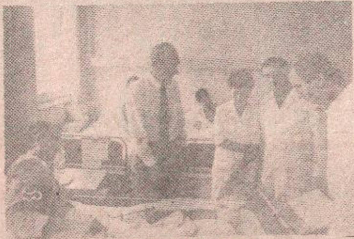
Принц Томислав у посјети рањеницима

ПРИНЦ ТОМИСЛАВ КАРАЂОРЂЕВИЋ ПОСЈЕТИО РАЊЕНИКЕ У ВОЈНОМЕДИЦИНСКОМ ЦЕНТРУ БАЊА ЛУКА