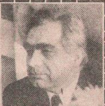
Изетбеговић није ни путовао у Женеву.

Ко је у Женеви заступао интересе муслимана? Алија