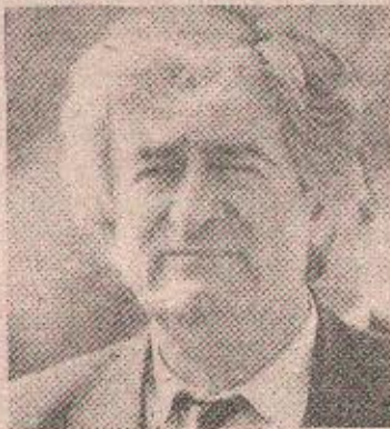
Др Радован Караџић: муслиманима је боље да прихвате подјелу него да наставе рат

два дијела. Нисмо потенцирали питања која се тичу Републике Српске Крајине, јер су у Женеви вођени разговори између представника Републике Хрватске и представника РСК, али наћемо одустати од глобалног рјешења српско-хрватских односа, односно од глобалног питања опстанка српског народа западно од Дрине.