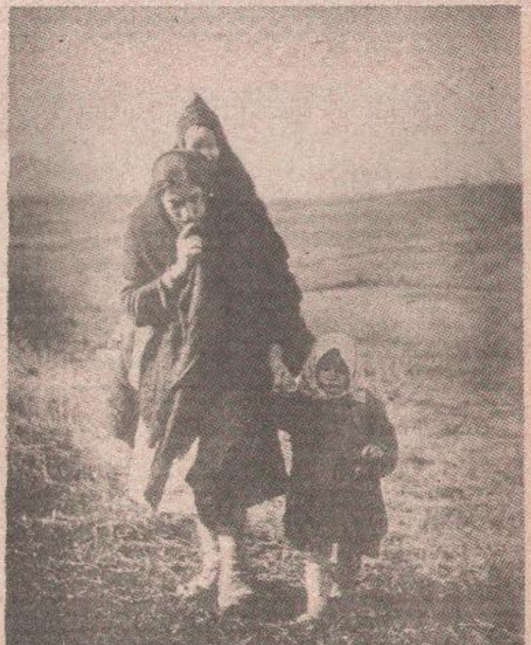
Добра фотографија је боља од лоше репродукције. Жорж Скритин: „361er“.