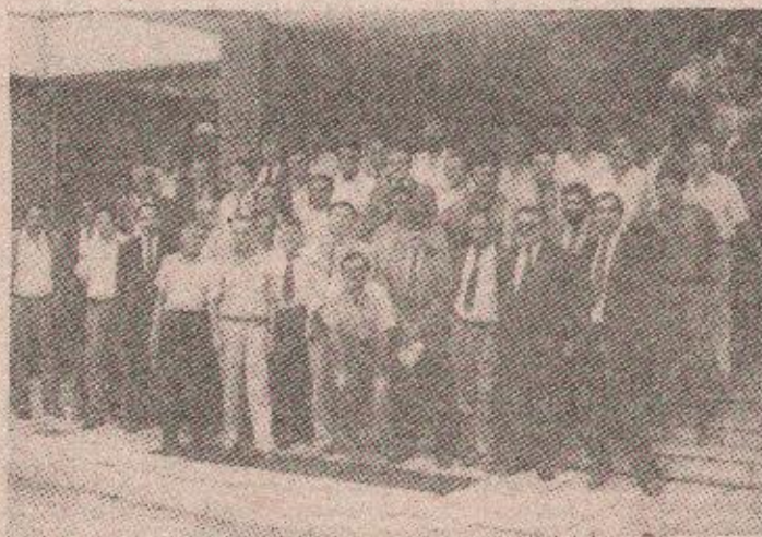
Гости у Бањалучкој пивари