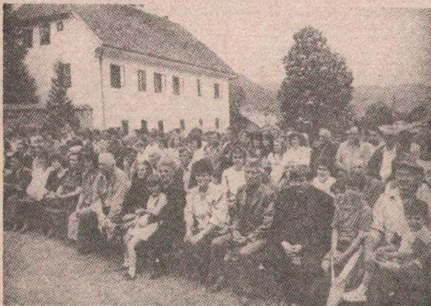
Свечаности је присуствовао велики број гостију