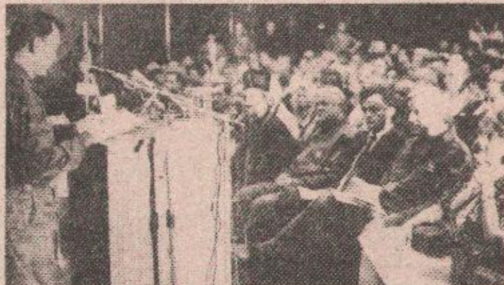
Начелник Главног штаба Војске Републике Српске, генерал-мајор Манојло Миловановић при поздравној бесједи