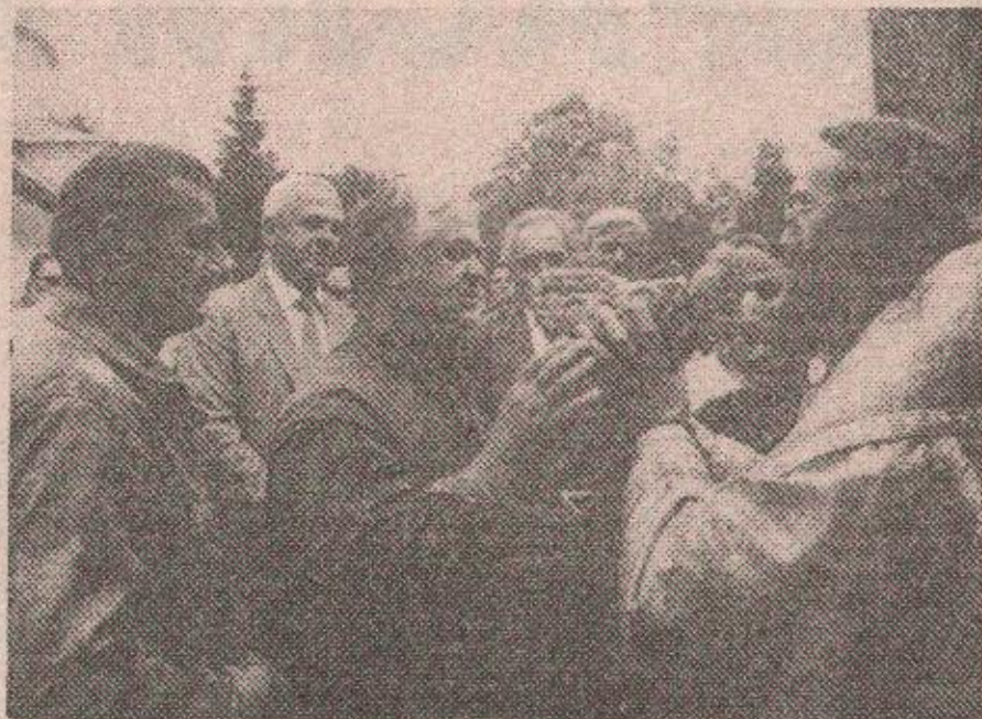
Помљење славског колача

Након свечане литургије и трократног опхода око манастира, служен је парастос свим српским јунацима у досадашњим ратовима. Потом је освешћен славски колач и кољиво и вјерницима подијељена нафора.