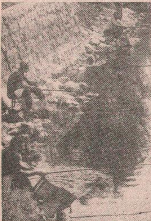
Спорт или ручак: На обали Врбаса

Гледајући ових дана како грађани обиру раскошно расцвјетале липе, којима наш град обилује, допазећи на тај начин до бесп-