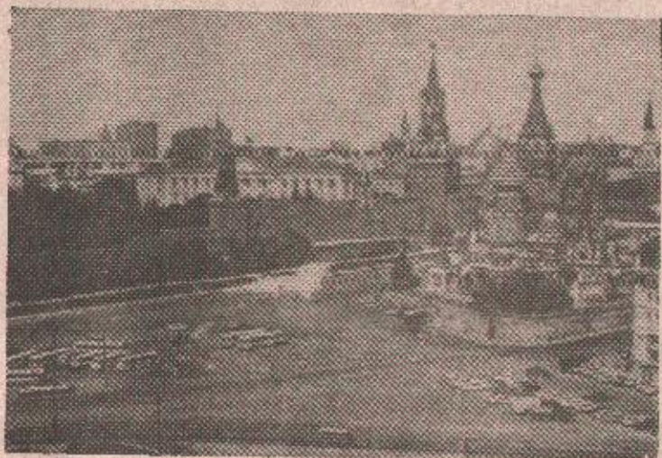
Москва - ни потврда ни деманти америчких оптужби

Посматрачи и дипломатски избори оцјењују да Москва ни у ком случају не жели конфронтацију са Вашингтоном и настоји да ублажи разлике уколико се оне око неких питања појаве.