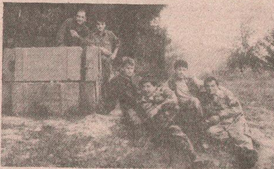
Група извиђача 3. батаљона у паузи борби око Брчког