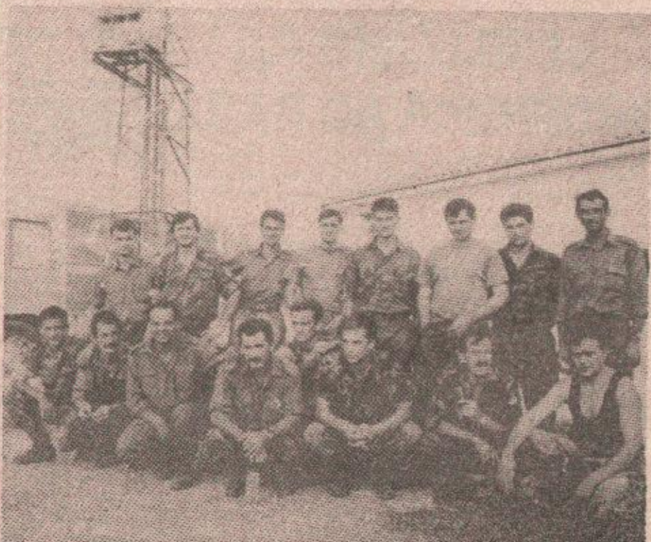
Понтирици при кратком предаху у „базу“