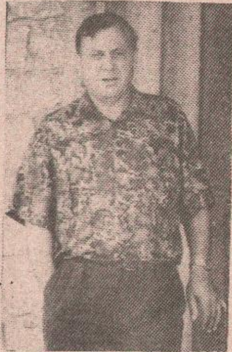
Направићу у селу кућу, птица да ме буде, птица да ме успављују—