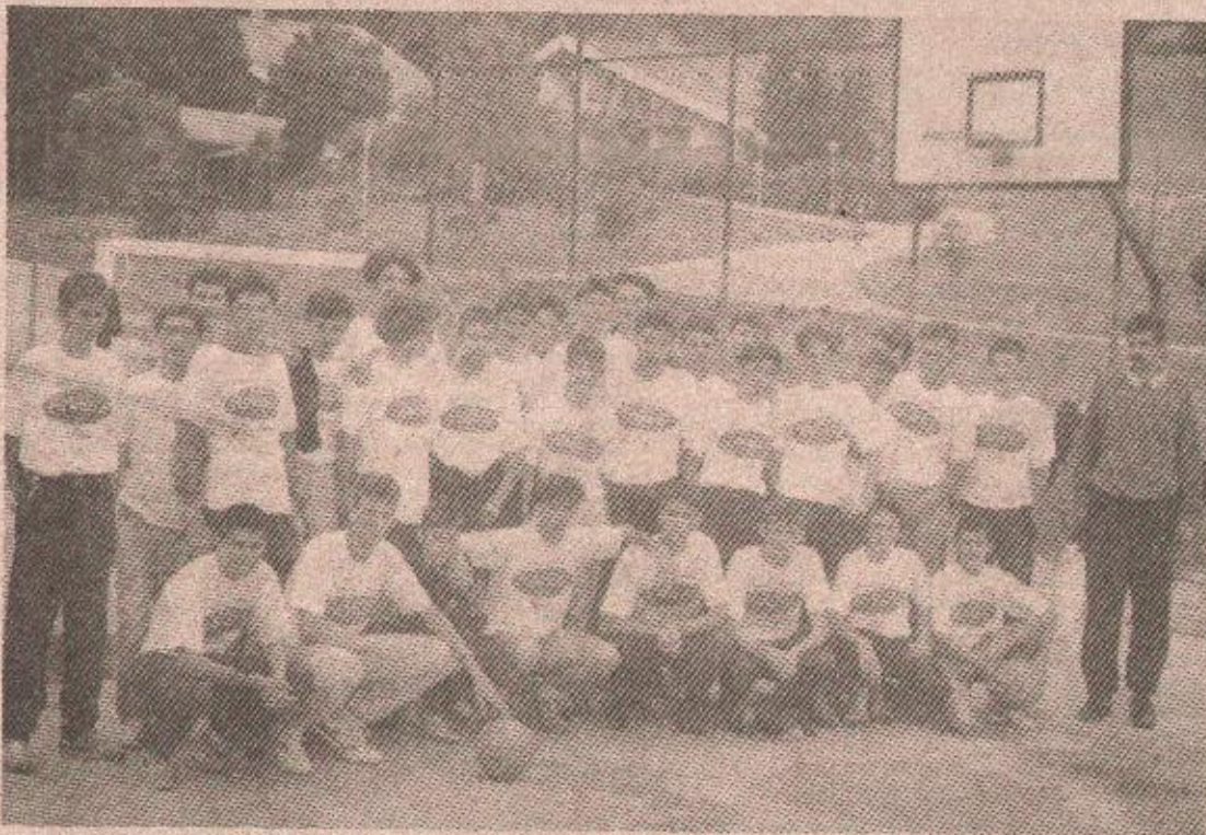
НАПРЕДУЈУ: Попазници кошаркашког кампа 1993. године на Балкани

— Као тренер, могу слободно рећи да је рапидан напредак играча, посебно актера