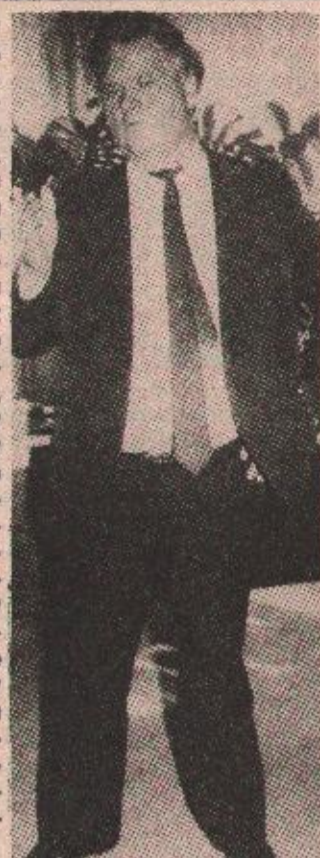
„Алија је кривац за страдање и рат“ — Фикрет Абдић

• Уз свакодневно умирање од метака и граната, муслиманима пријете масовне епидемије: жутица, куга, тифус, као и умирање од жеђи и глади • Зар муслиманима није био довољан један противник него је требало створити још једног? • Нажалост, у овом тренутку нисмо у стању поразити војно надмоћнијег противника • Никакво председништво нити преговарачки тим не могу суспендовати вољу народа, који ће у сваком случају дати посљедњи пристанак за будући модел уређења босанскохерцеговачке државе