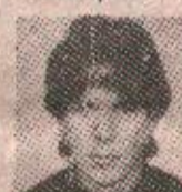
МИОДРАГА БАЈУ МИШИЋА