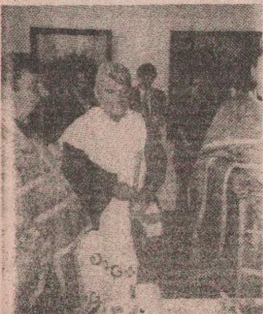
Са изложбе у Приједору

• Изложба „Геноцид над Србима“ изазива занимање у свим српским земљама, потврђујући велика дјела