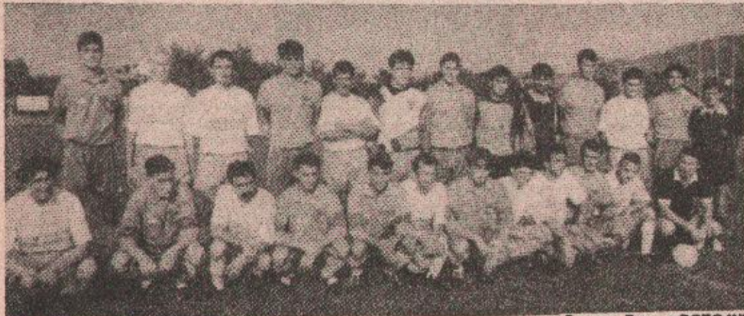
СРПСКА БРАТА: Заједнички снимак актера недељног меча

— Нисам могао на вријеме да дођем на припреме јер аутобуске везе између Грахова и Бање Луке не функционишу. Био сам стварно на великим мукама како да стигнем на Градски стадион. Успио сам у томе захваљујући људима из поште, који су ме својим колима довели у Бању Луку.