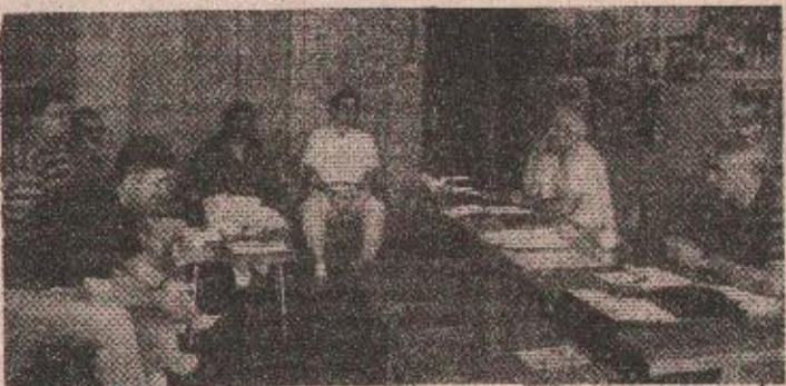
ЛИГА ВЕТЕРАНА КРЕПЕ: Са данашњег извлачења пороза у Редакцији листа „Глас српски“