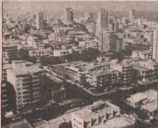
Хавана - четрдесет година кубанске револуције и изолације

„Ембарго ће обиљежити моју судбину“, процијенио је тада, без грешке, Фидел Кастро. Послије распада источног блока, Кастро чини прагматичне кораке који могу донијети Куби додатна конвертибилна средства и ограничити државне расходе, али при том држи на „тачкицама“ и леду минимални лични стандард и поручује суграђанима да могу очекивати само теже дане.