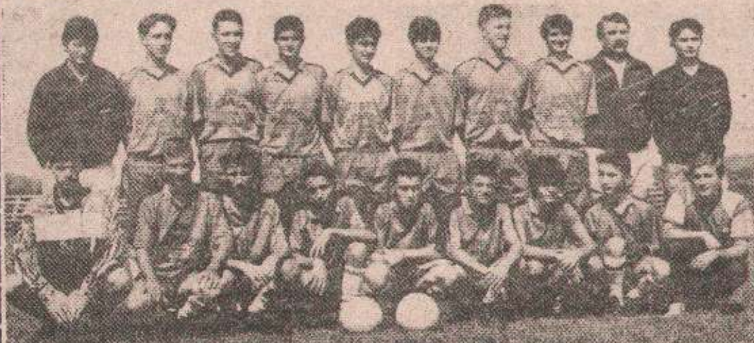
ИЗНЕДАНИ БОРЦА: Кадети Омладинца са стручним руководством клуба