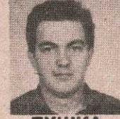
ДУШКА Ж. СТОЈАКОВИЋА

31. 7. 1993. у суботу навршава се тужна година како смо изгубили нашег првог и најдражег унука, сестрића и брата