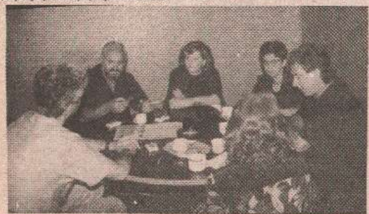
онтано да се удружимо у свом болу и да проблеме покушамо ријешити заједничким снагама

довољни како их примају неки високи официри и наводе да је потпредседник Владе Репу-