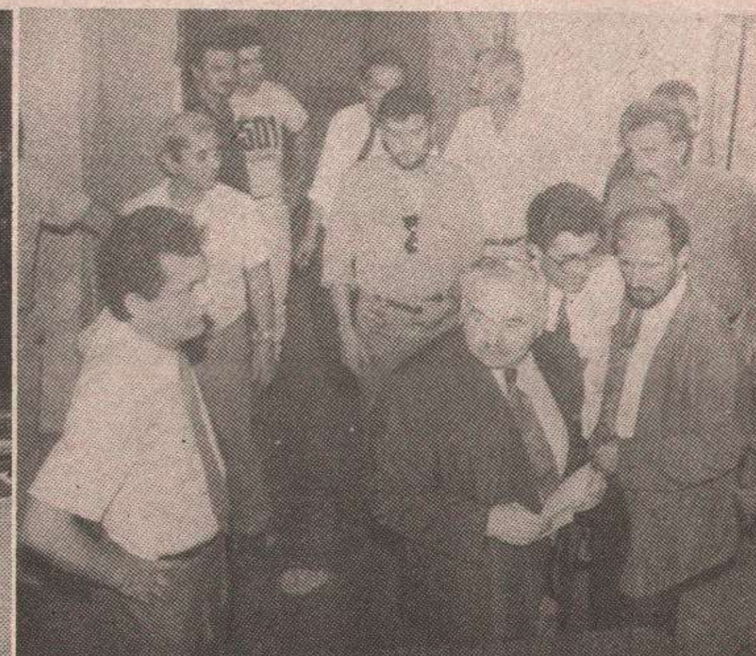
Све је спремно, посљедње консултације