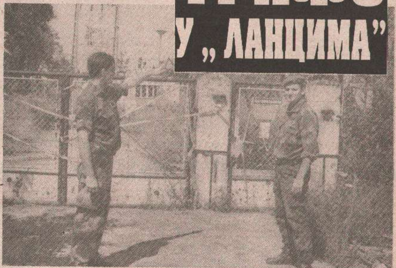
Улаз у трафо-станицу забрањен: да ли и за раднике „Електропривреде“?

БРЧКО 31. јула — Седмодневне крваве борбе за ослобађање дијелове Брчког: Суљагића-сокака и села Брод, но још више блиставе побједи Војске Републике Српске, донијеле су након више од годину дана, радост на крајишке просторе. Ослобођене су територије кроз које пролазе високонапонски водови толико жељене струје, за Бању Луку и трафо-станица, која у тој трансмисији представља главну станицу.