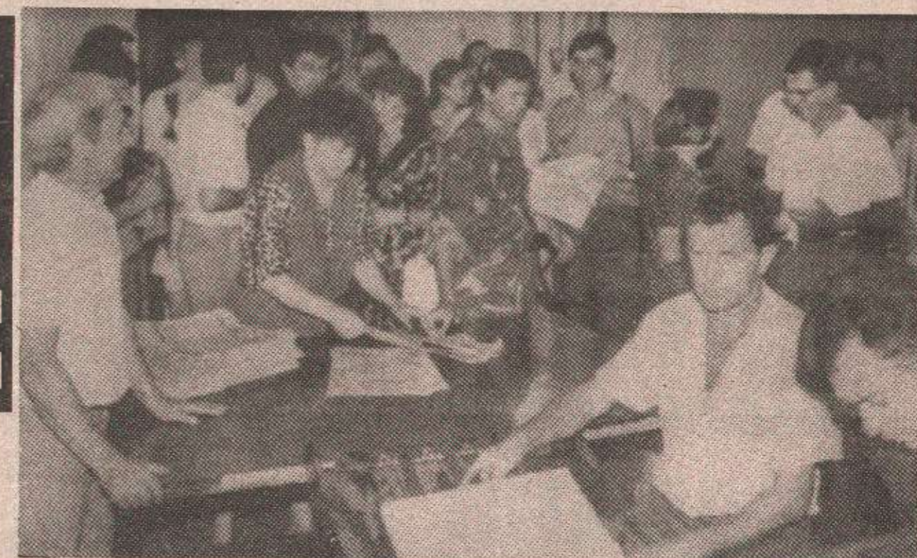
Све тече, све се мијења

БАЊА ЛУКА, 1. августа - „Глас српски“ ушао је у своју пуну зрелост, али како рекосмо у претходном броју у којем смо окренули нови лист - педесет година нам је тек. За ту прилику приредили смо мапу свечаност. Позвали смо све своје да нам дођу у госте. Да виде гдје смо и шта радимо. Да заједно са нама обиљеже овај за нас и наше читаоце значајан дан.