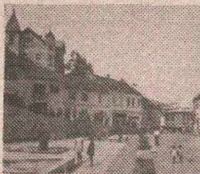
Зворник очекује мир

БРАТУНАЦ, ЗВОРНИК, 31. јула (Танјуг) - Најновији споразум о прекиду борбених дејстава се за сада поштује на лијевој обали Дрине у широком појасу на рубним дијеловима општине Схелан-