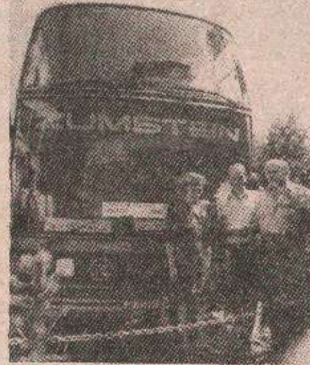
Удобно и угодно путовање аутобусима „Росић рајзена“