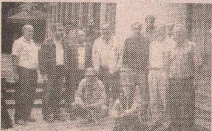
У СПУЖБИ ТУРИЗМА: Бањолучки спортски радници

српске територије од стране „Туђманове демократије“ присутна увијек. Ипак, љепотица ове младе државе — Плитвичка језера, након дуго времена, треба да буде пробудена.