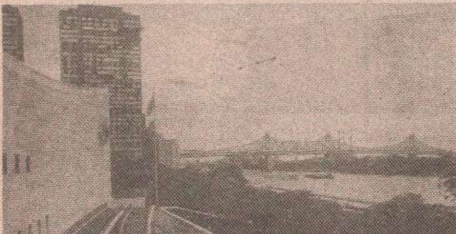
Уједињена нације - јасно упозорење Хрватској

„Савјет безбједности упозорава на озбиљне последице сваког одступања од примјене споразума“ од 16. јула, додаје се у синоћном саопштењу.