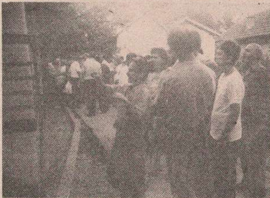
Дјеца са испраћења дјете у Сутоморе