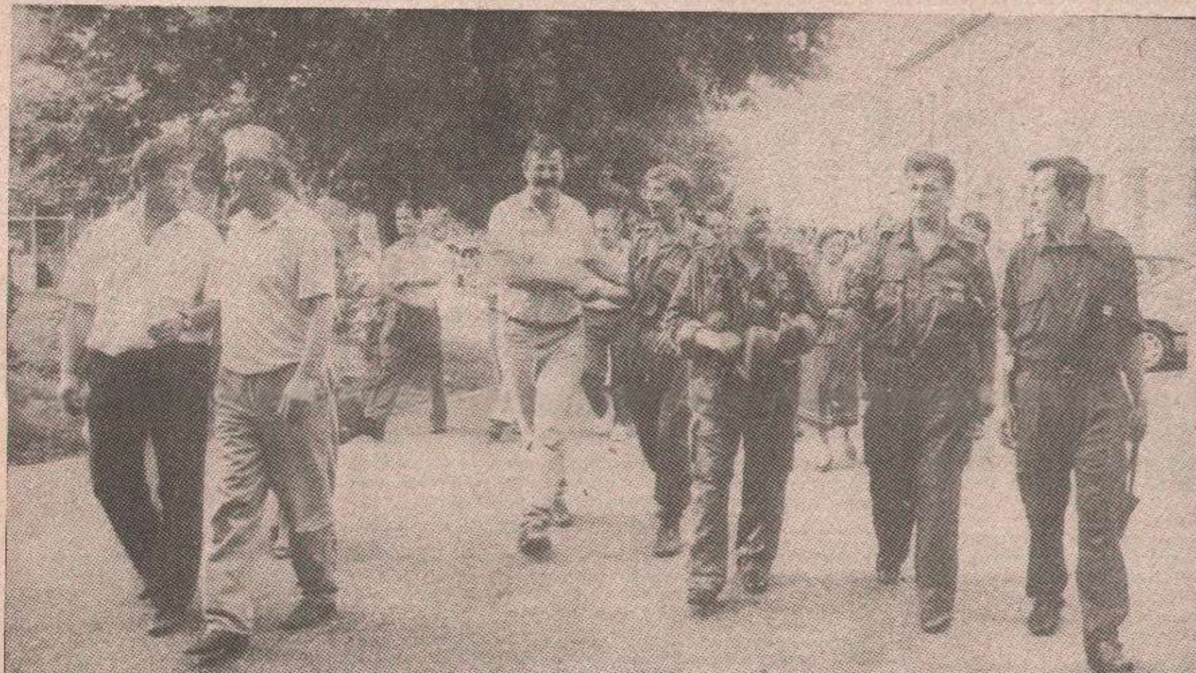
Гости пристижу: Прва честитања