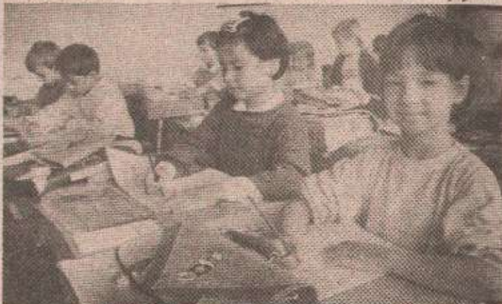
Дјаци чекају уџбенике, а наставници плате

Школа у ратним условима још је „на почетку“ и није у могућности да прати предвиђене сложеније моделе савременог рада у перспективу, јер су и рјешавање практичних питања везаних за средства, те обезбјеђање