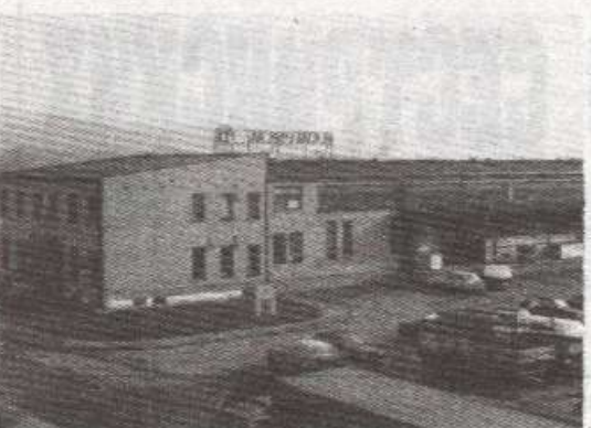
Складиште „Меридијана“ у Бањој Луци

Да нису сва предузећа у Бањој Луци због ратних дејстава и нестације електричне енергије свега пословање на минимум доказ је и ДД „Меридијан“. Након три пословнице у Бањој Луци и по једне у Книну, Градишци, Новом Граду и Рачи, ово предузеће за међународну шпедицију, увоз и извоз трговину, отворило је још једну, у Приједору.