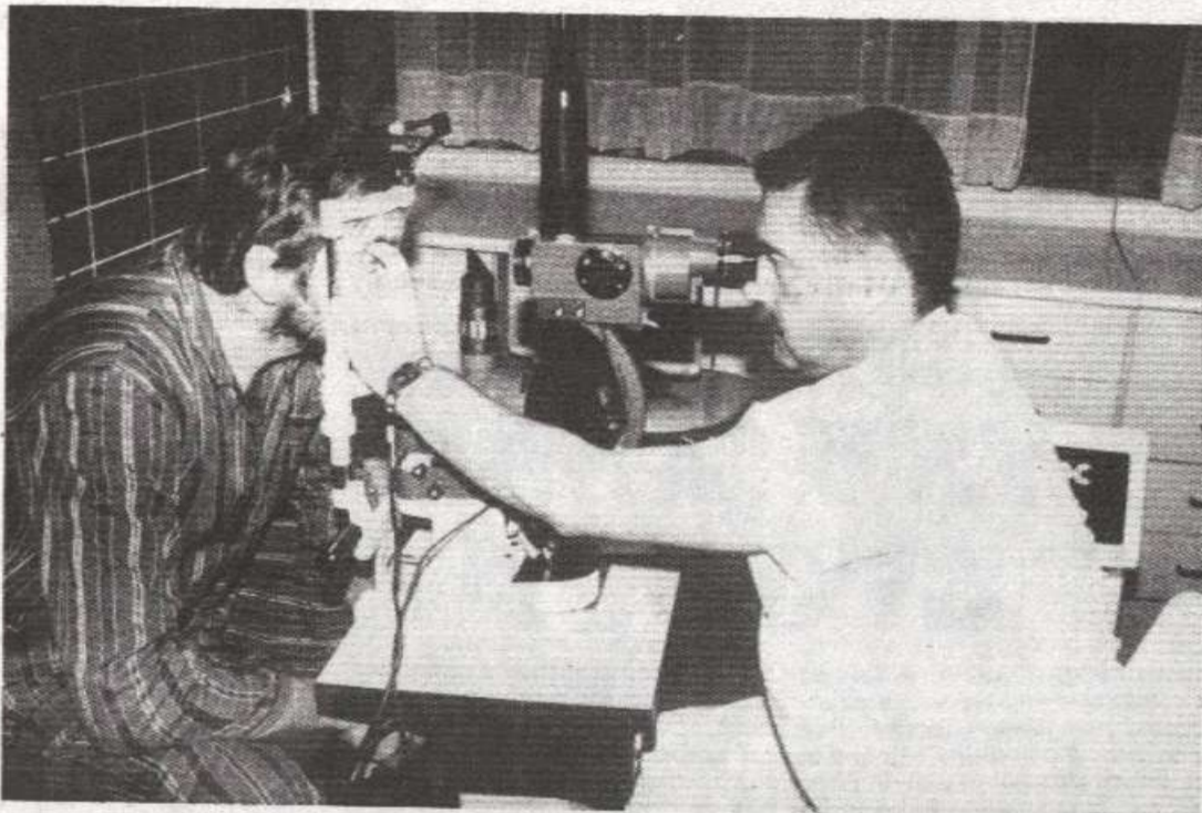
Двије године од набавке до монтаже: Терапија ласером од сада и у Бањој Луци