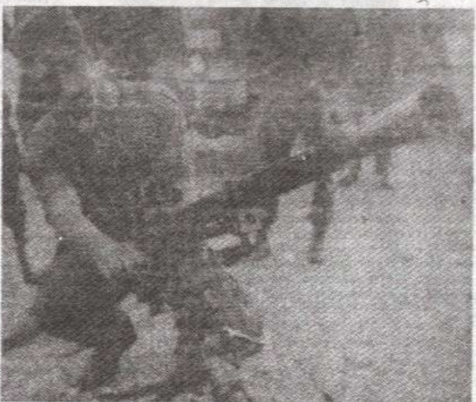
Српски митралез на Игману

До Бјелашнице и Игмана се долази из првага Трнова, земљаним путем „рођеним“ комбинацијом пријатних шумских путева и новопробираних траса кроз беспуна црногорике и камена. Саобраћајни знакови, путско знаци на овој брдској „магистралу“ су трагови тешких кавича (гутиснути у земљу), оборени балвани, пољупчане гране, изваљени пањевци... У облаку дима се као на