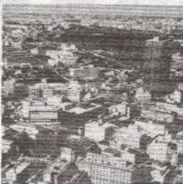
Токио: Од времена شوгуна до православне цркве

Руски свештеник Николај Касаткин зачетник православља у Јапану Служба на јапанском језику, а може и на енглеском или неком другом по жељи вјерника • Опљачани мозаик ипак први у свијету.