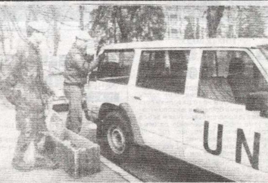
УНПРОФОР на иштану „зелених беретки“

На вод плавих беретки који се јуче упутно ка Игману из правца Хацића муслиманске формације су отварале ватру, а прелијетање тромблонских мина „зелених беретки“ изнад возила са ознакама Уједињених нација потврдили су и припадници УНПРОФОР-а.