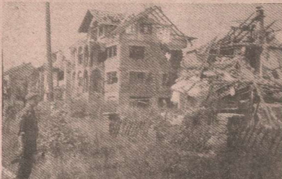
Вихор са брчанског ратишта

— Љути смо и на наше саборце који избјегавају фронт. Срамота је то — говори Опачић. — готово брука. Док је батаљон на одмору — они здрави, батаљон на фронт — они код доктора! Како то? Други се, опет сакрију. Трећи кажу: Хајте ви, по нас ће доћи полиција па ћемо комбијем на фронт ко господ. То не може тако — ред и закон се морају знати.