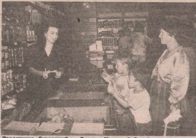
Продавница „Еуросплет“ — „Веселин Маслеша“: Осмијех и слаткиши за малишане

Холдинг „Сана“ Нови Град са својим чланицама „Трикотажа и конфекција“ Нови Град, „Сана-Ексклузив“ Сански Мост, „Сана — Линеа“ Српска Костајница, „Сана — Сан“ Добрићин, „Сана — Младост“ Руишка, „Сана — Елвис“ Сводна, „Сана — Комерс“ Београд, „Сана — Трговина“ Нови Град, „Сана — Угоститељство, Нови Град, производи женску конфекцију, а основни производ је женско рубље.