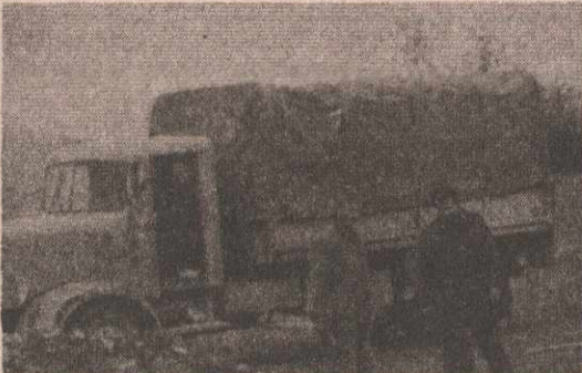
Највећи проблем за оправку камиона су дијелови, којих најчешће нема

Највећи проблем и овог ауто-батаљона су резервни дијелови. „То питање рјешава и позадина, али често и сопственим импровизацијама, скидањем са „отписаних” возила.