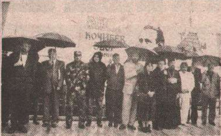
Учесници и гости овогодишњег Кочићевог збора

Упркос киши која је падала цијели дан око двије хиљаде Змијањаца и бројне госте ништа није омело да присуствују завршном дијелу Међународне културне манифестације Кочићев збор у Стричићима на Змијању. На змијањској Грчкој Градини подигнуте заставе Кипра, Грчке и Румуније, земаља из којих су ове године учествовали писци и pjesници на Кочићевом збору