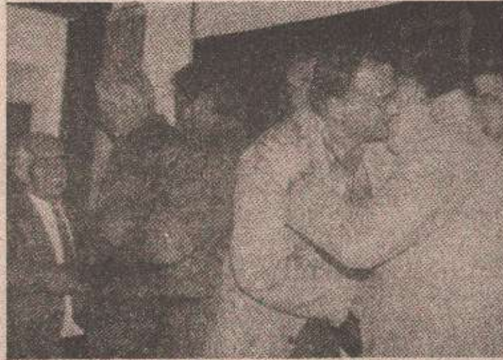
ЧЕСТИТКЕ — РОЂЕНА СРПСКА ДРЖАВА