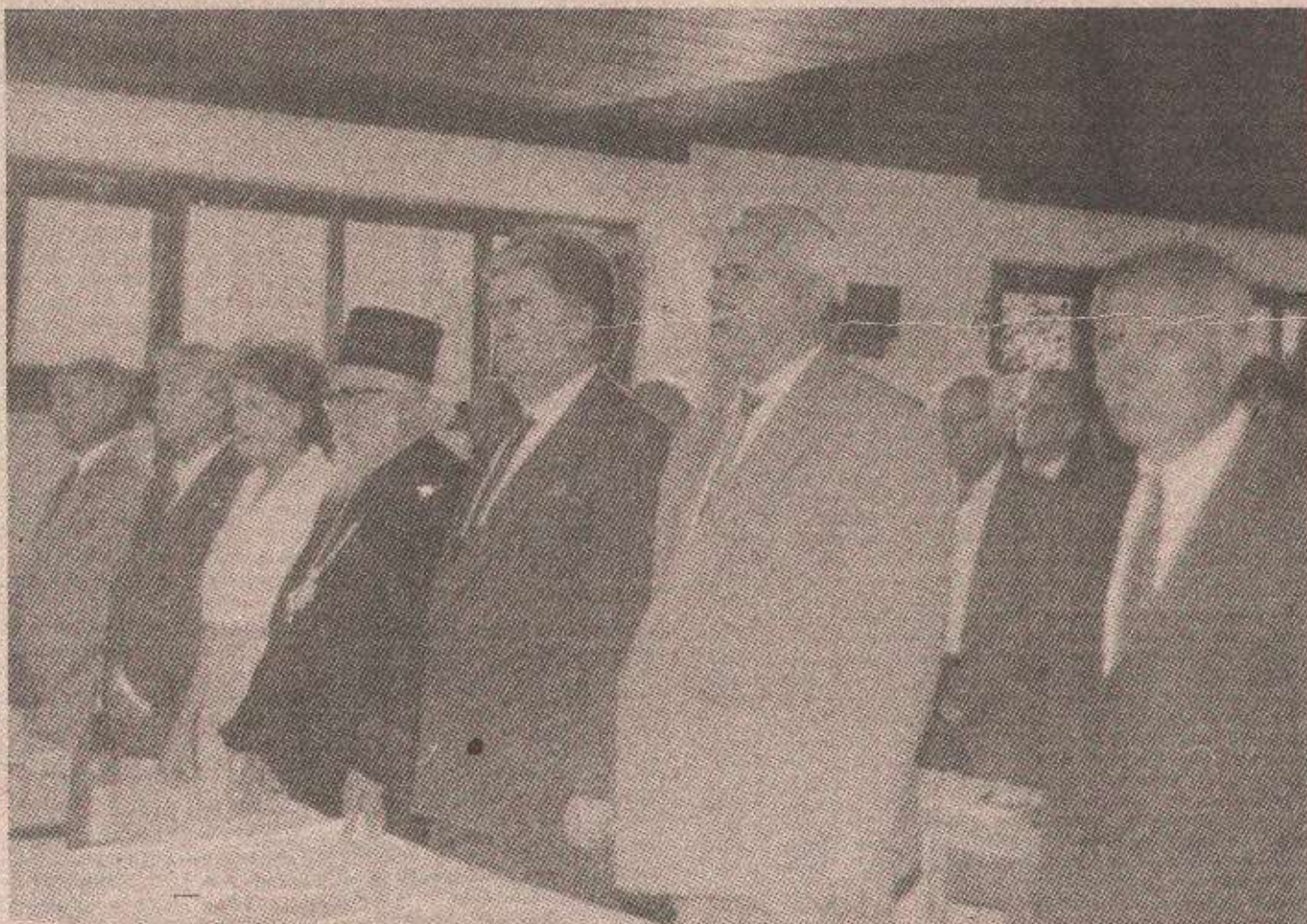
Стране 2, 3 и 4.

Народни посланици су на приједлог Главног одбора Српске демократске странке синоћ касно усвојили и посебну платформу која, у ствари, представља смјернице преговарачком тиму Републике Српске за даљи рад у наставку женевских преговора.