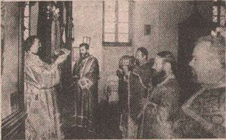
Света литургија у цркви Клисина на Змијању