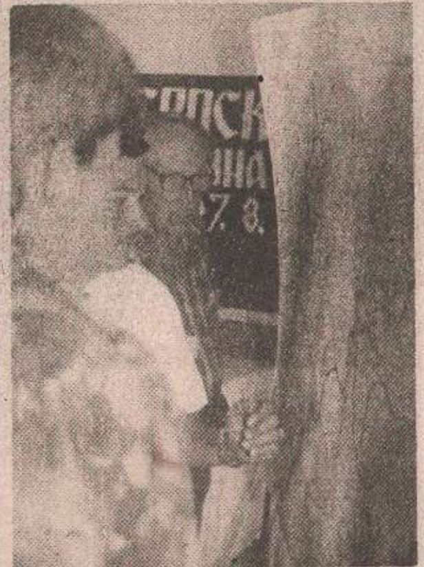
ПОСЛАНИЦИ ПРЕД КАРТОМ ТЕРИТОРИЈАЛНОГ РАЗГРАНИЧЕЊА У БИВШОЈ БИХ

„Уколико нека од страна изађе из овог споразума, онда ћемо и ми повући све уступке, прије свега територијале, гдје смо показали спремност да уступимо српске етничке територије“, истакао је Буха додајући да је највећи уступак српске стране тај „да се бар у овој фази одричемо заједничке државе са државама српског народа“.