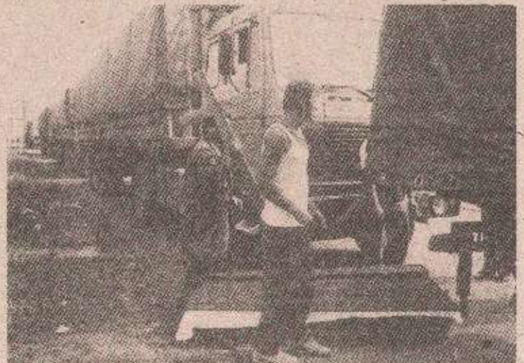
У путу су умрле двије жене...

ватски народ као мањински „ухвати тамо гдје је мислио да може опстати“. Испоставило се, међутим, да су муслимани „народ без ајере у Бога и у људе“ и да су издајнице.