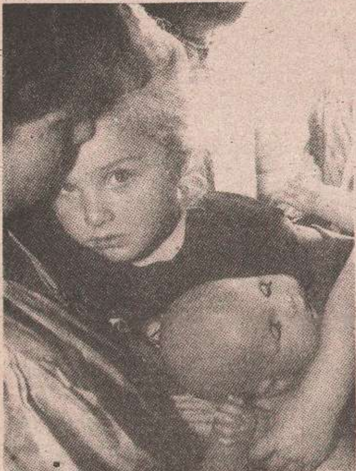
У конвоју је било највише жена и дјеце

Милкица МИЛОЈЕВИЋ