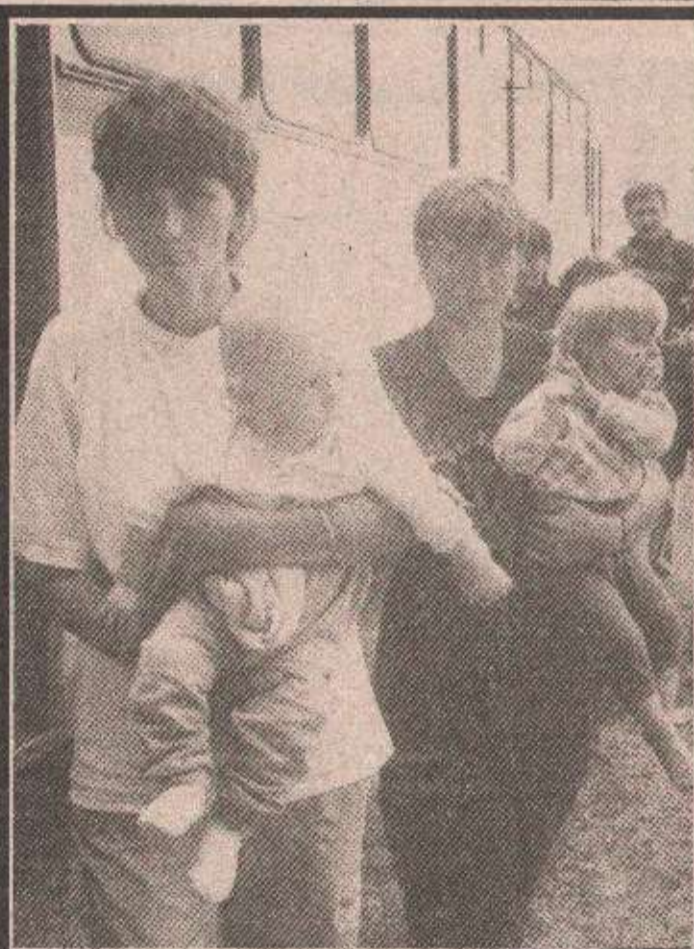
ТРИ ХИЉАДЕ ХРВАТА, ИЗБЈЕГЛИЦА ИЗ КАКЊА, ПРЕКО РЕПУБЛИКЕ СРПСКЕ ОТПУТОВАЛО У ЛИВНО