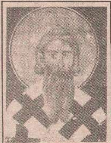
Под утицајем српског архиепископа Саве Немањина, познатог у народу као Свети Сава, дошло је до црквене реформе у погледу слава крсне славе: крсна жртва замијењена је бескрвном, а црквени ритуал прешао је у слављеничке домове.

свог заштитника који је заједницу чувао од злих сила. Управо и слава, односно крсна слава, имала је и за циљ колективно сјећање на претке као кућне племенске заштитнике.