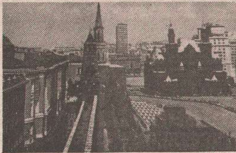
Москва — нови таласи сукоба присталица и противника Бориса Јељцина

МОСКВА, 1. септембра (Танјуг) — Председник Русије Борис Јељцин потписао је указ којим се ослобађају дужности потпредседник руске федерације Александар Руцкој и први потпредседник владе Владимир Шумејко. Указ председника федерација ступа на снагу одмах.