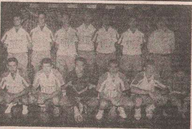
Млади рукометаши Борца на прагу прве титуле

БАЊА ЛУКА — У суботу и недјељу 4. и 5. септембра у бањолучкој Спортској дворани „Борик“ одржаће се финални турнир првог Купа Републике Српске у рукомету. Као што је познато, за завршни турнир, након полуфиналних борби у четири града, квалификовали су се: Борац (Бања Лука), Приједор, Игман (Илиџа), Партизан (Козарска Дубица), Јајце и Хаџићи. Екипе ће бити подијељене у двије групе, а носиоци су Борац и Приједор.