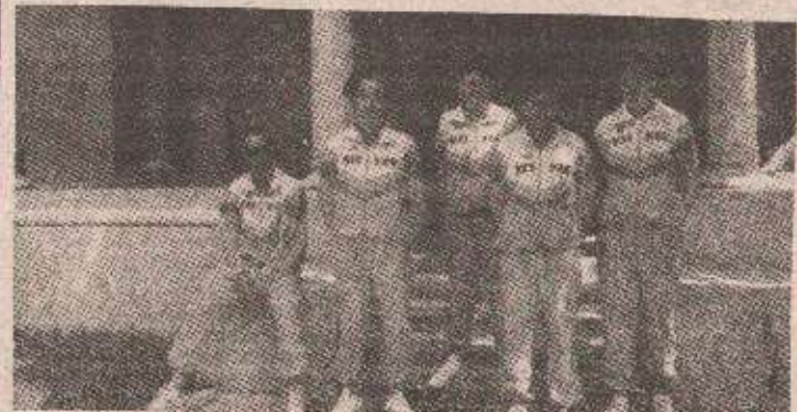
РЕПРЕЗЕНТАЦИЈА РЕПУБЛИКЕ СРПСКЕ