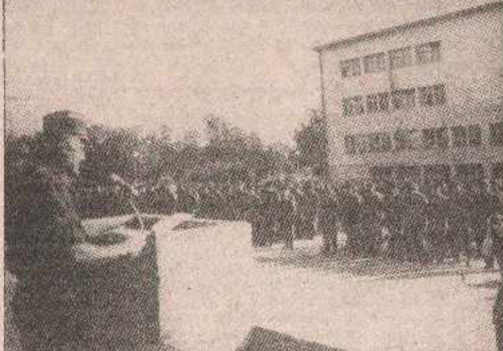
Генерал Ратко Младић: „Постаћете успјешни браноци свог народа“

— Данашњим даном почиње са радом школа за официре и подофицире за потребе Војске Републике Српске и Републике Српске Крајине. Овдје су изабрани најбољи борци, који су се у рату доказали. Наш и ваш задатак је да усавршимо руковођење и командовање да усавршимо војну науку. Без добре дисциплине и обучености нема ни успјеха у борби. Ми треба да се спремамо