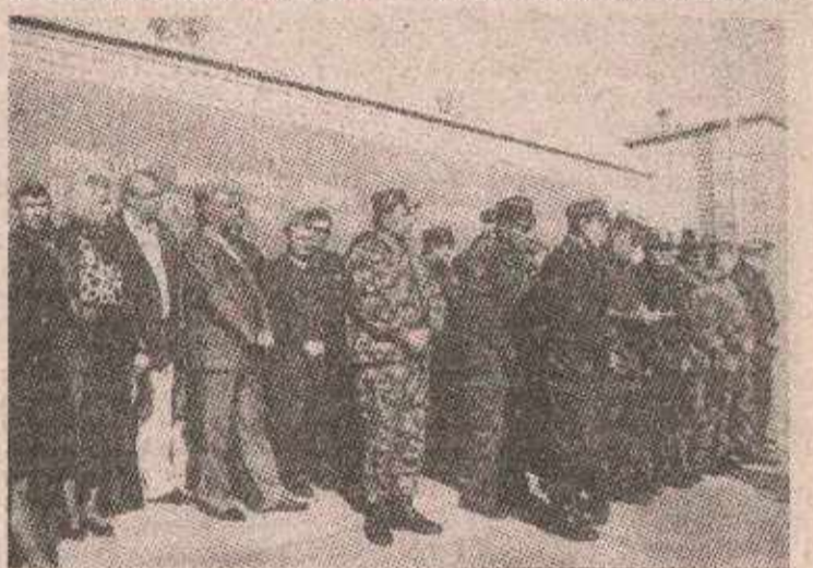
Високи гости поздрављају питомце

им путем разријеше наметнуту нам ратну драму и ја сам увијек да ће у томе успјети.