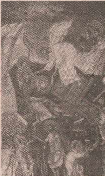
Урамљене слике на зидовима собе чине славску атмосферу потпунијом

Након отпјеване пјесме, опет се сједа, пије и једе до мрака (домаћин не сједа за сто, него стоји гологлав и служи гостима вино и ракију). Тако се слави три дана (више не устају у славу други дан славе зове се појутарје а трећи уставци), а пријатељи одлазе четвртог дана.