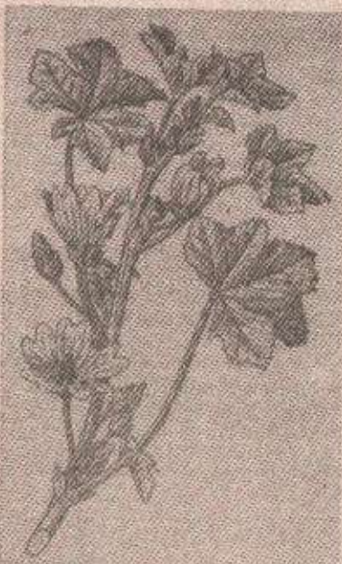
На Биљанин петак, пред Ђурђевдан, жене иду у поље да беру траве — коприву, Ђурђевак, мљечкику, бијели сљез и друге које имају своје значење, и свака се оставља скривено да дочека Ђурђевдан

Тако, на примјер, постоји обичај да уочи Ђурђевдана мајка у лонац са водом ставља разна биље: дрен, да би дјеца била јака као дрен, здравац, да кућа буде здрава, грабеж, да се момци грабе за дјевојку. Биљке се затим стављају под ружу у башти.