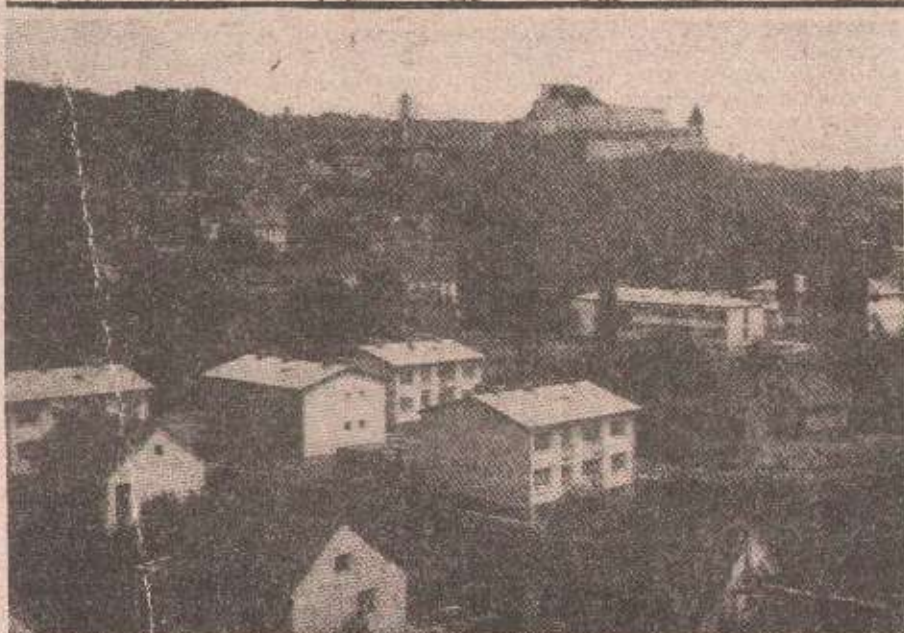
Гранатиран и центар Добоја

На требавском региону непријатељске снаге су отварале снажну ватру из пјешадијског наоружања из рејона Панића, док су српске положаје у рејону Свјетлице гађали из противавионских топова и минобацача.