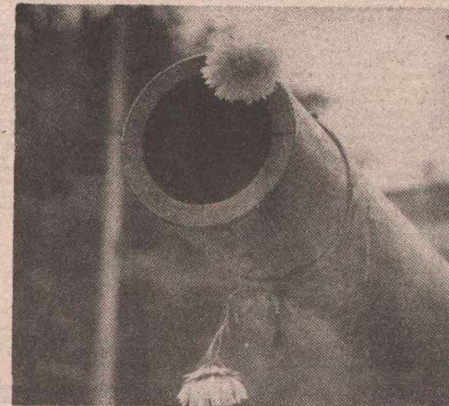
Цело уместо гранате