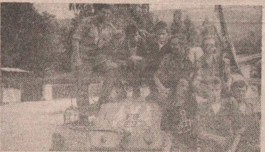
„Правилни“ солидарни са борцима Шеснаесте