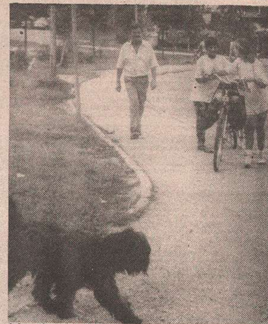
Субота, пијани дан и дан за шетњу