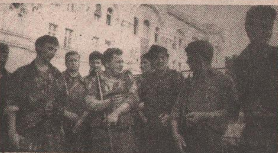
Верујемо у Кризни штаб, јер знамо да нећемо одустати од наших захтева

данас Кризни штаб договорно, али верујем у његов рад. Верујем зато што знам, као и сви моји другови, да ми од наших захтева нећемо одустати, да нећемо отићи из Бање Луке док услови које смо поставили не буду испуњени. Нормално је да ћемо се вратити на своје прве линије после реализације наших захтева и да наша борба неће због тога да трпи, нити ће