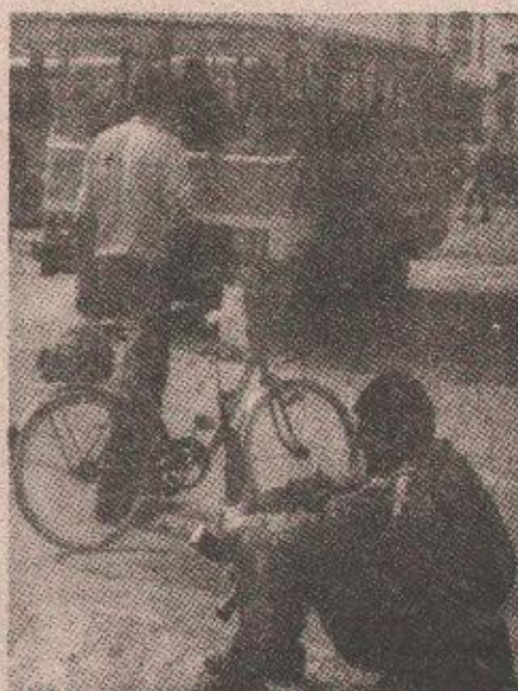
Бања Лука јуче: тензије се смирују

На новинарско питање дали су борци обавештени о досадашњем току акције „Септембар 93“ одговорено је: