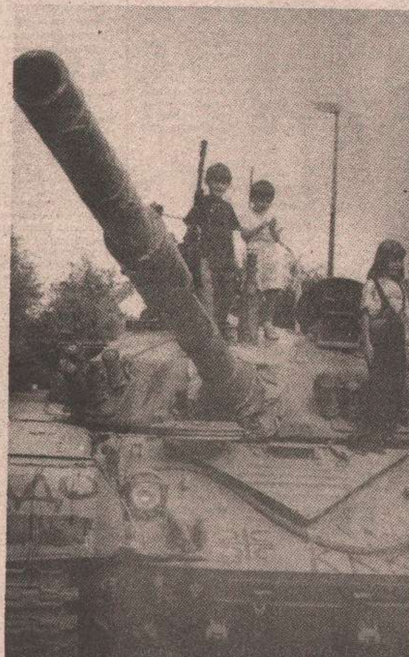
„Игрочи“ за један дан: деца се играју на тенку