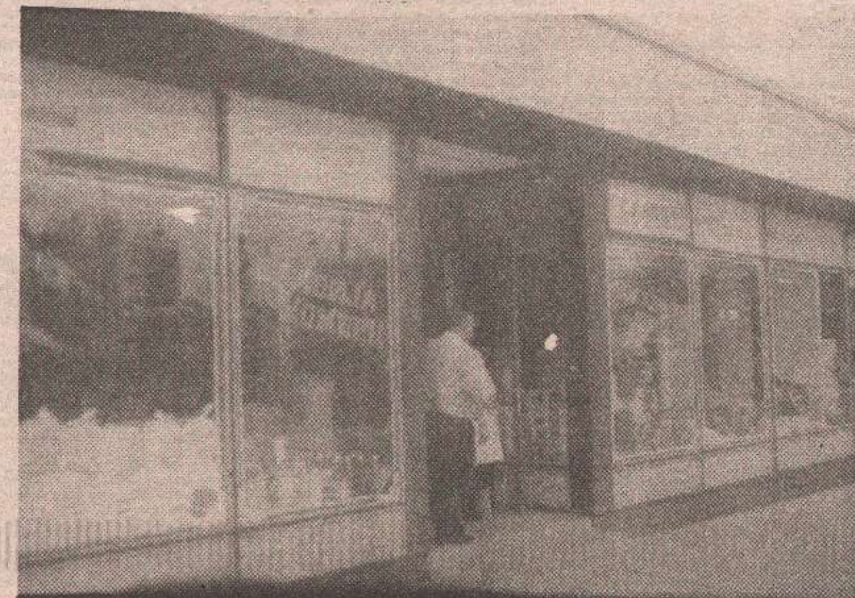
Продавнице су редовно радиле