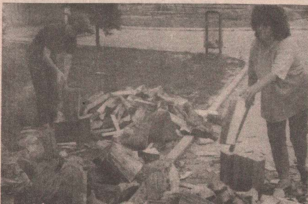
Припреме за змију нису остављене