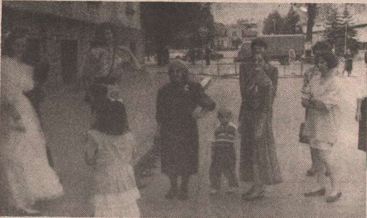
Датум је одређен, није било одлагања: венчање је одржано