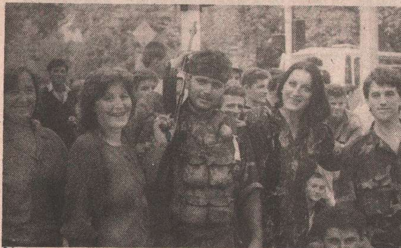
Војска је народ, народ је војска: дете са бањолучким улицама