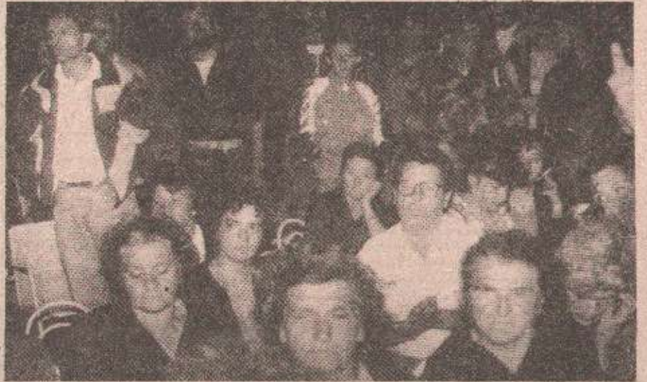
Делегација са Пала дочекана аплаузом

Данас је веома тешко. Многи су покушали да нам се представе великим пријатељима, а видели сме да то чини. Многи би жељели да манипулишу нашим увлећеним мајкама, сугругама, децом и нашим ранама. Многи би да нас поделе, али не смејемо се поделити ни по коју цену. Ја вам гарантујем да то неће успети. Иако је овај бунт, да га тако условно назовем, дела јединица изазвао револт и одобравање како кога. Највише су се радовали наши непријатељи, али ми морамо из овог извући нову снагу, не дозволити поделе, не одбаивати нашу децу и препустити да државни органи и органи у Војсци Републике Српске решавају нагомилане проблеме, и плус да се организујемо ако продужи наш непријатељ да јуриша на нашу спо-