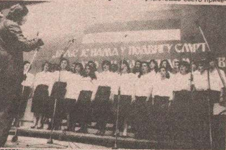
Видовдан — светковина у спомен на изгинуле српске борце у свим ослободилачким ратовима: Са видовданских свечаности у Бањој Луци

Сматра се да се 900 година прије Христа појавио пророк Илија који је тада пророковао велику сушу као казну због отп-