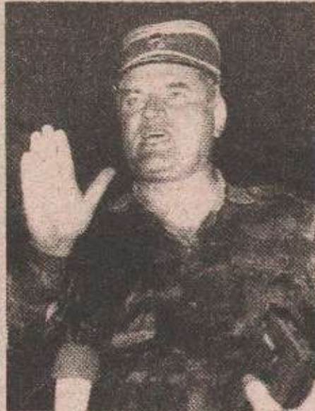
Генерал-потпуковник Ратко Младић окупљеним Бањолучанима обратио се са хаубе „пуха“

Ја вам могу са сигурношћу обећати да ће све оно што је оправдана примедба, да ће бити санкционисан онај због кога је написана та примедба, било да је у редовима Војске или негде другде. Али исто тако морамо се више него икада до сада осврнути на сами себе и упитати се да ли је наш метод, да ли је наше чињење, да ли је наше поступање примерено времену. Оправдан је револт многих, и многе ствари можда нису казне ни за појединце ни за групе, али није било време ни метод најприкладнији, међутим, што је, ту је. Ја бих вас замолио да искажете максимално поверење нашем руководству, и ја вас могу уверити да у руководству државе и у Главном штабу влада потпуно јединство, и нема никаквих раскола ни подела, јер то не смејемо ни кад бисмо хтели, ради огромног интереса нашег народа, и то не само у Републици Српској, већ и у Републици Српској Крајини и шире. Иза оправданог незадовољства у разним срединама, било војничким, било у предузећима, покушало се изманипулисати нашим осећањима, а ја знам да су наша осећања јединствена и за опстанак на нашој родној грудни, и за очување наше државе Републике Српске.