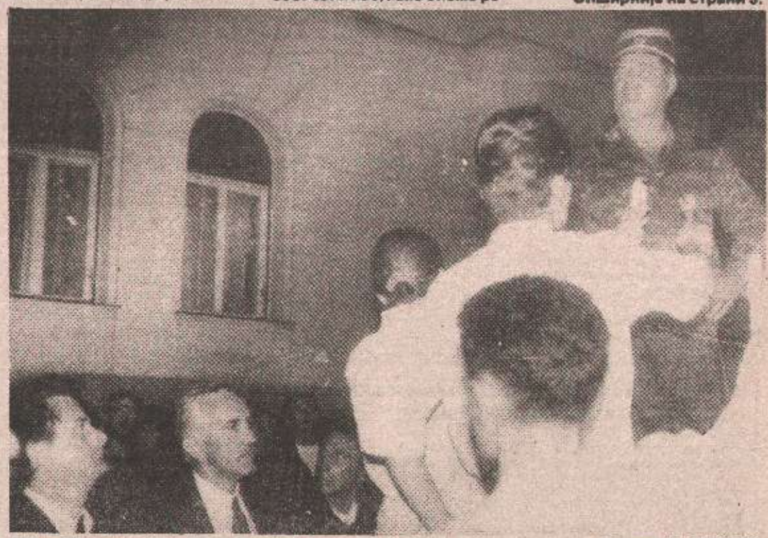
Генерал Младић се обраћа грађанима и борцима Бање Луке

блике Српске, у центар Бање Луке, вечерас у 19.45 часова, и његовим обраћањем присутним члановима породица погинулих бораца, грађанима и учесницима акције „С 93“ напетост у граду на Врбасу изазвана овом акцијом и неизвесношћу њеног краја, могла би бити смањена, а даљи ток акције примити мирније токове. Наиме, Кризни штаб је прихватио да оде на разговор са др Радованом Караџићем председником Републике Српске. Иначе, данашњи, четврти дан акције „Септембар 93“ почео је прилично грозничаво. На јутрошњој конференцији за новинаре, коју је одржао Кризни штаб акције, речено је да од преговора са председником Караџићем „за сада неће бити ништа“ да се, наводно припрема напад на учеснике акције, али и то