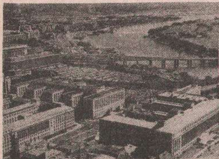
Вашигтон - изостала обећања

Господин Клинтон је рекао босанском лидеру да САД и Западна Европа неће војно интервенисати да би поништили фактичко стање