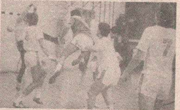
У суботу нова узбуђења у „Борик“

у сваком случају, четири одигране утакмице на турниру шампиона на неки начин су нам биле припрема за предстојећи сусрет. Познато је да нашу екипу чине врло млади и још недовољно искусни играчи, тако да би им освајање овог купа, посебно што је први, био највећа награда и огроман стимулент за даљи рад. Лично мислим да су нам шансе