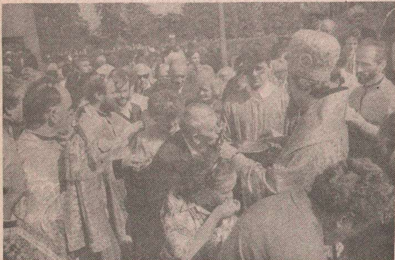
Епископ бањолучки господин Јефрем после свете литургије поделио је верницима нафору