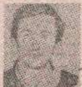
(МИПЕ (ПЕТРА) ВЈЕШТИЦЕ