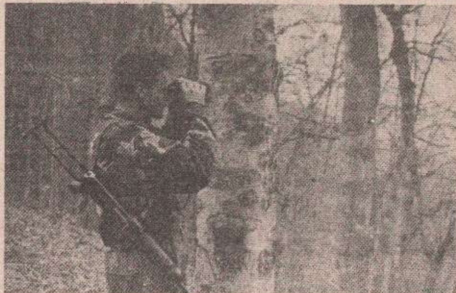
Српски борац осматра положаје

На требавском подручју непријатељ је бровинзима дејствовао из рејона Бегове главе по рејону Гаврића, као и по рејону Циганишта. У долини реке Спрече на удару муслиманских нападача је било српско насеље Сихје, али без последица. Повремених провокација из пешадијског наоружања било је и на