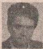
ПЕТРА ПЕРЕ ЦРНАТКА

Дана 22.9.1993. године навраћа се 6 тужних месеци од смрти нашег драгог и доброг оца