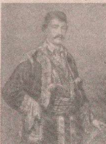
Милан Обреновић као војвода

Споразумом с Марашлијом завршава се први део живота и рада Милоша Обреновића. Други део његовог живота и рада много је плоднији и много важнији за стварање српске државе у 19. веку и за коначно ослобођење српског народа испод турске власти. Тај други део његовог рада завршава се присаједињеном Србији нових 6 нахија 1833. године. Заслуга за то припада највише кнезу Милошу. Он је то питање поставио и уз припомоћ Руса на