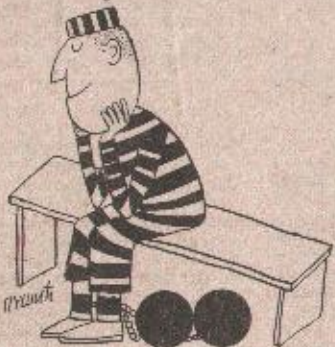
аутор: Рајко ПУШИЊ