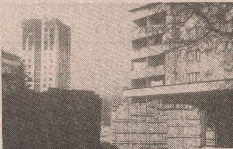
Сарајево: Заштита од снајпера — зид од бетонских елемената

„Кога да сада слушам председнице, вас или Ганића?“