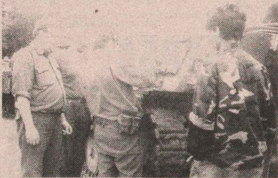
Оклопна грдосија застала — мајстори су ту