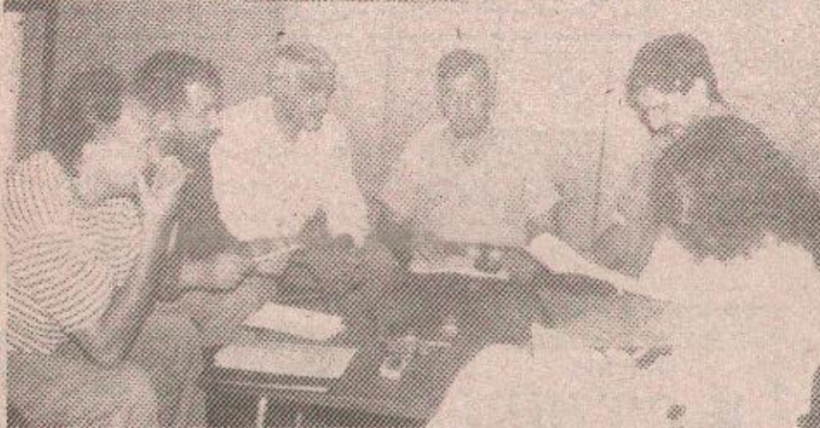
Са конференције за новинаре

• У суботу и недељу у дворани „Борик“ четири екипе - Семберија, Дрина, Борац и Орлови, бориће се за титулу првог првака у кошарци Републике Српске