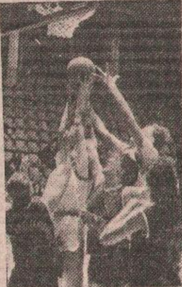
ПУНОМ ПАРОМ ДАЉЕ: Кошаркашице „Бојчета импекс“ МК