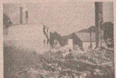
пска села Брезове Дане, Радојичићи и Црновићи.

У новошехерској котлини, код Жепча, још све мирише на паљевину. Крајем октобра екстремни Хрвати су запалили десетак напуштених муслиманских кућа у Тујници, тако да је и ово село убрзо завршило у пепелу. Током љета, у време жестоких борби на овом подручју између дојучерашњих савезника Хрвата и муслимана са лица земље су нестала муслиманска села Копице (на слици), Домислица, Чобе, Аве, део Струпина и део Горње Тујнице. Пре годину дана, у време када су садашњи непријатељи били савезници, потпуно су уништена ср-