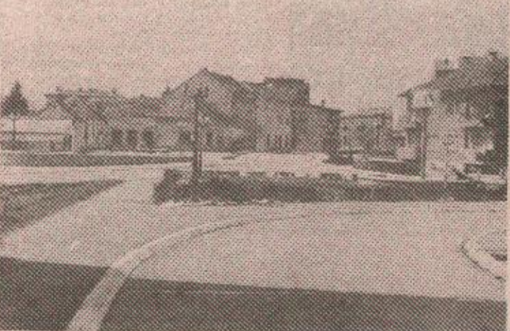
Брод, поново град - годину дана након ослобођења

— Срби су пре рата радили углавном у комуналним департментима и циглани или као „гастарбајтери“ у Славонском Броду. Сва важнија места у Броду заузимали су муслимани и Хрвати. То нам се сада свети. Кадрова нема. Велики проблем ће то бити кад Рафинерија нафте обнови рад. Недавно смо договорили са Војском да 44 радника „Метал“ емајла“ привремено упуте на радну обавезу, како би довршили производњу вредну 15 милиона марака. Кадрови су