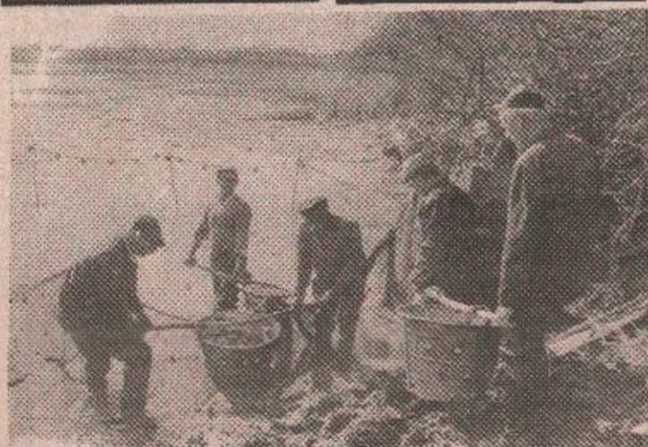
Са прошлогодишњег излова