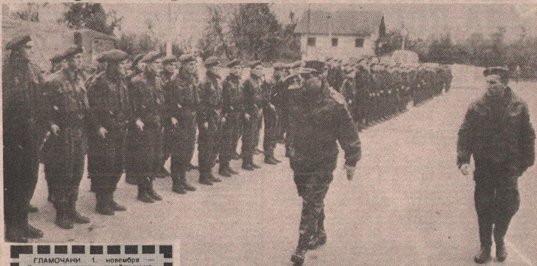
Пред свечаним стројем Одред бањолучких специјалаца МУП-а Републике Српске