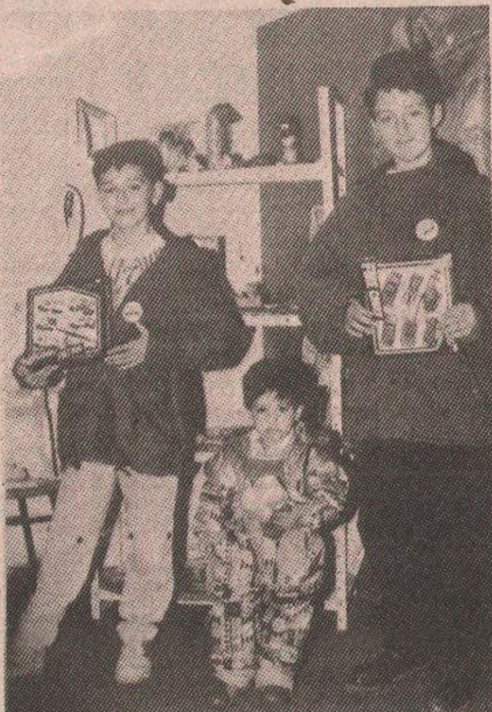
РОЂЕНДАНСКА ПРОСПАВА У „ГЛАСУ СРПСКОМ“

ПРОМОЦИЈА ПРОГРАМА ВЕЛЕТРГОВИНЕ „ГЛАС СРПСКОГ“