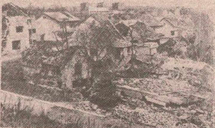
Оно што није порушено, хрватски војници су пре повлачења темељито опљачкали

ће повећати производњу колико год то тржиште буде захтевало. Међу „пионирима“ обнове Брода је „Електродистрибуција“. Са свега десетак људи електродистрибутери су обновили више од 240 километара високонапонске и нисконапонске мреже, тако да у Броду данас има струје колико и у Бањој Луци. И водовод је обновљен. Воде има свакодневно 360г тога у порушеном граду није било, за ових годину дана ниједне епидемије.