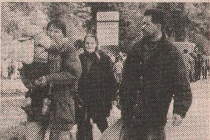
Нека је жива глава, а за остало ћемо лако