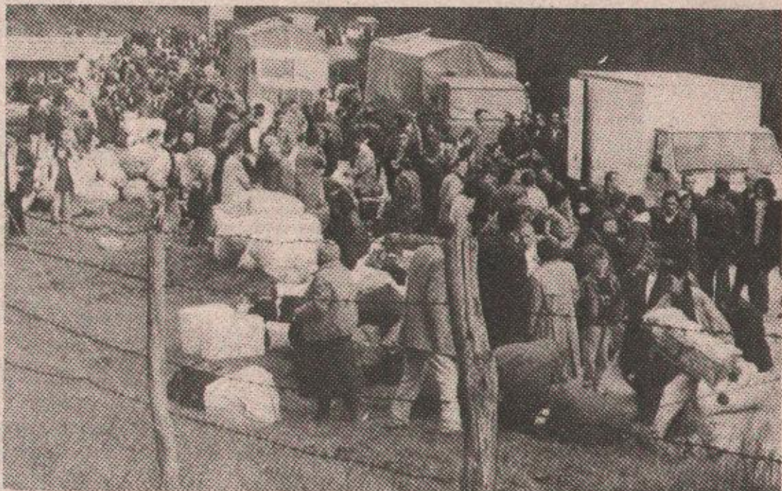
Срби из Травника: Срећни што су крочили на српску земљу