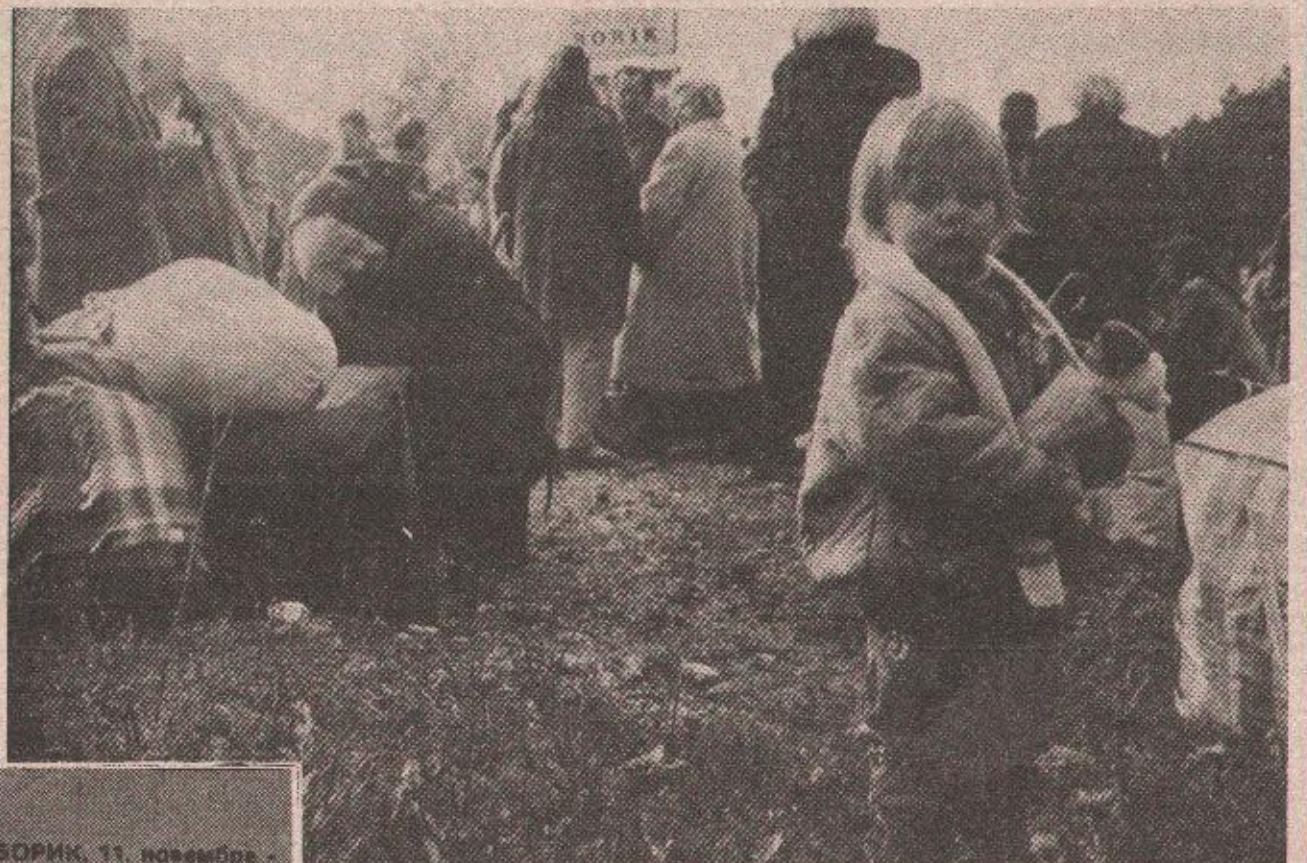
У неком другом граду ова девојчица ће покушати да настави прекинуто детињство