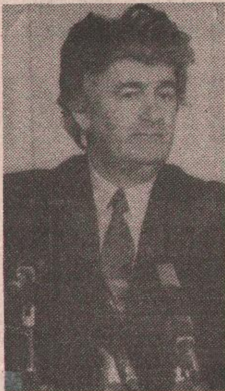
Др Радован КАРАЦИЋ — Женевски пакет основа за даље преговоре

ДР РАДОВАН КАРАЦИЋ — ИНТЕРВЈУ ЗА СРНУ, СРПСКИ РАДИО И СРПСКУ ТЕЛЕВИЗИЈУ СА ПАЛА