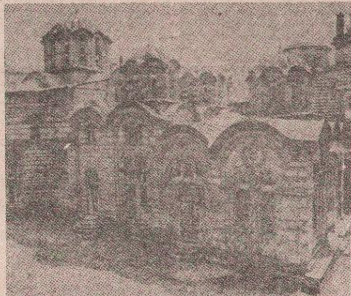
Саборна црква у Хиландару