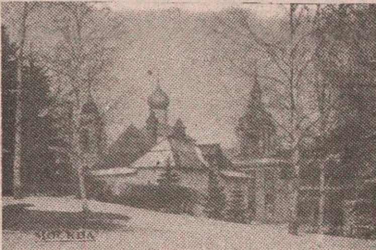
Москва - оцена да је прави тренутак за мир

МОСКВА, 24. новембра (Танјуг) — Заменик руског министра иностраних послова Виталиј Чуркин изјавио је да је јуче председником Србије Слободаном Милошевићем телефоном разговарао о решавању сукоба у бившој Босни и Херцеговини. Садашњи моменат, подвучао је Виталиј Чуркин, веома је погодан за последње одлучне напоре за регулисање кризе у тој бившој југословенској републици.