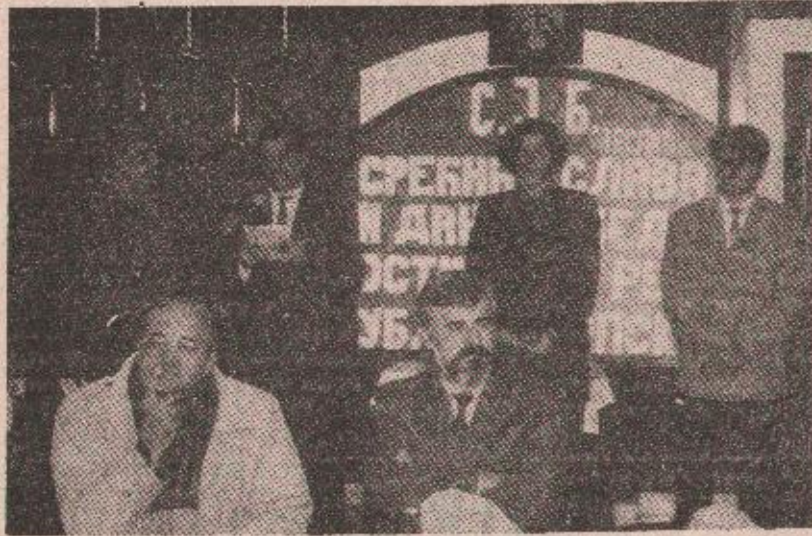
Са свечаности у СЈБ Теслињ