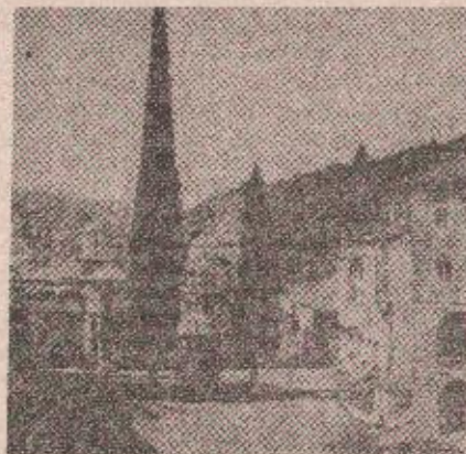
Саборна црква у Хиландару: место боравака иконе Тројеручице

искушеници, затим педесетак Срба ту затечени у посети, носеће највећу светињу-икону Пресвете Богородице до