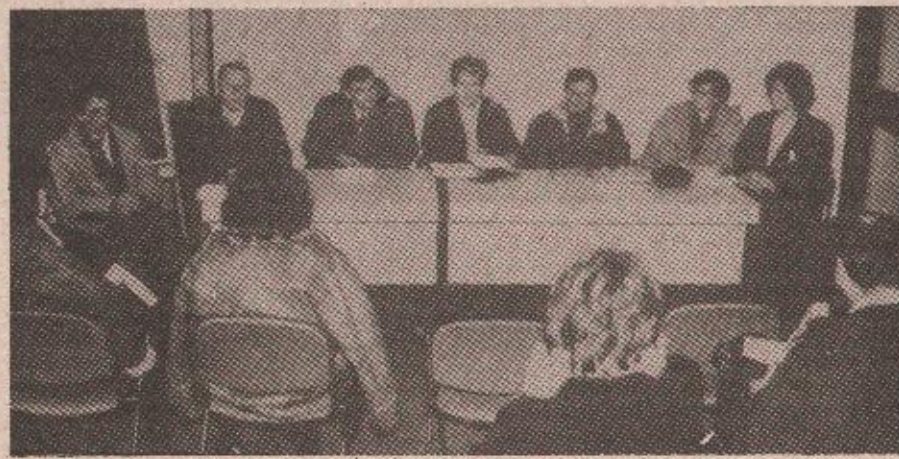
Са конференције за новинаре: Како помоћи деци у рату?