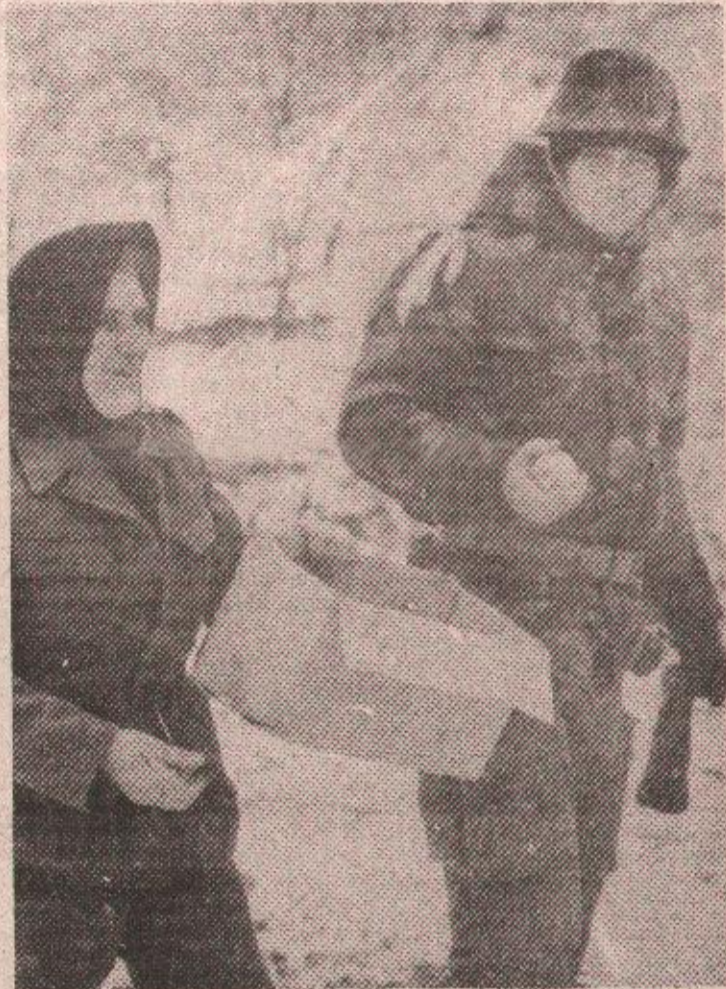
Српске мајке су уз своје борце, и под униформом стижу јабуке