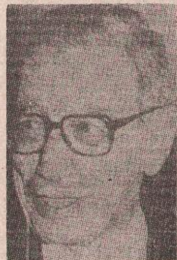
Бутрос Гали ће разговарати на оптужбе Изетбеговића

дности да је то бомбардовање било својеврсна порука европским министрима — „неспагање терориста са текућим мировним процесом.“