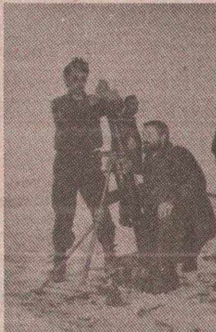
Узак спреми минобацачи

— Ови момци овде су већ четири месеца, тако да их је непријатељ добро упознао. Не напада више онако жустро као пре пола године, избегава јаче окршаје. Углавном садрже подмуклих, изненадних припуцавања, гађају снајперима