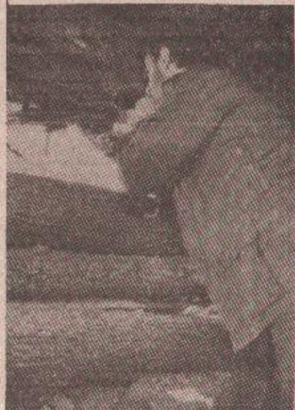
Ни лед ни не може ништа: Тениксти оклопног батаљона на положају