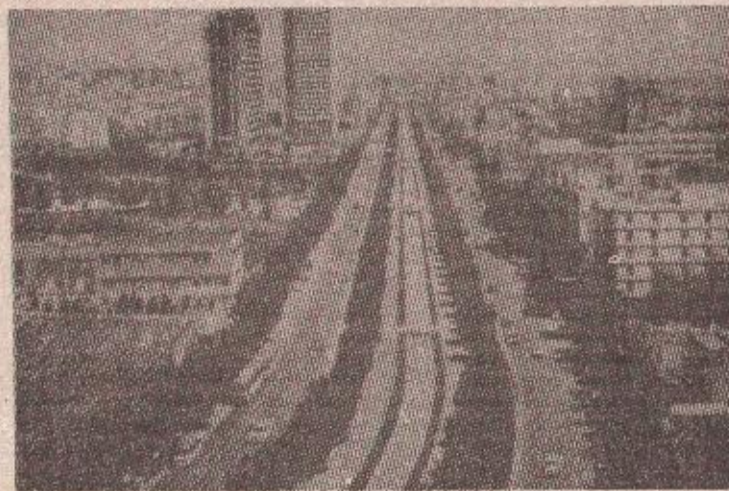
Техеран — ислам убија политичке противнике

Жртве су све чешће и хуманитарни радници из међународних организација којих је само у овој години досад погинуло 22 дво-струко више него лани.