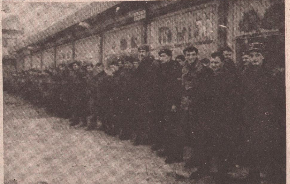
Елитна јединица: бањолучки милиционери пред полазак