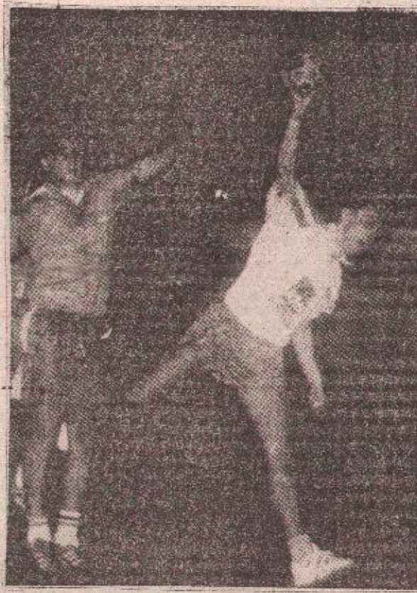
У „Борику“ нова рукометна узбуђења