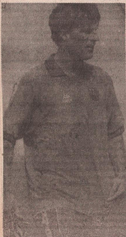
НИШТА ОД АМЕРИКЕ: МИХАЕЛ ЛАУДРУП (Данска)