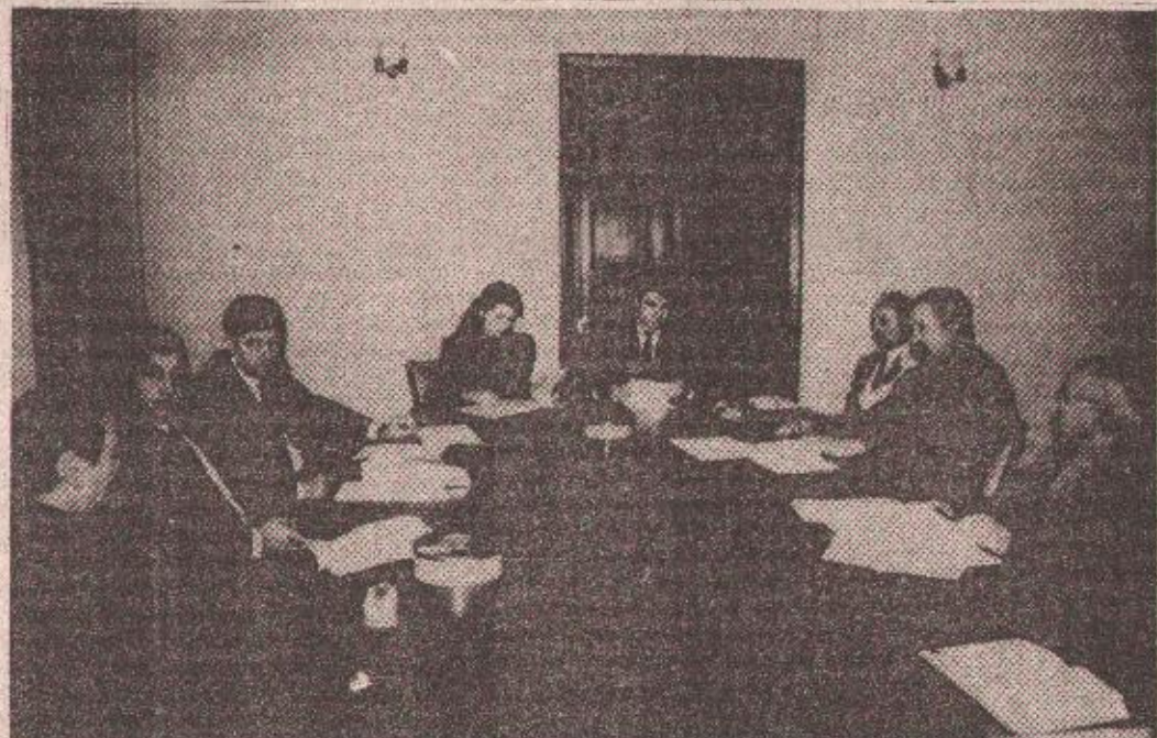
Са седнице Председништва НОК-а Републике Српске

Ово је један од основних елемената програмских задатака НОК-а Републике Српске, верификованих на данашњој седници Председништва Националног олимпијског комитета, одржаној у бањолучком Дому културе.