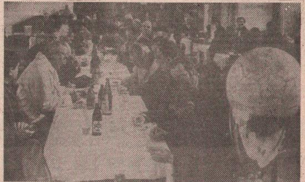
БРОЈНИ ГОСТИ: На извлачењу парова трећег кола Купа Републике Српске окупили су се представници великог броја клубова.