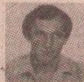
МАРИНКУ МАЊИ ДИЗДАРУ

Од припадника јединице ВП 7225/63 017802