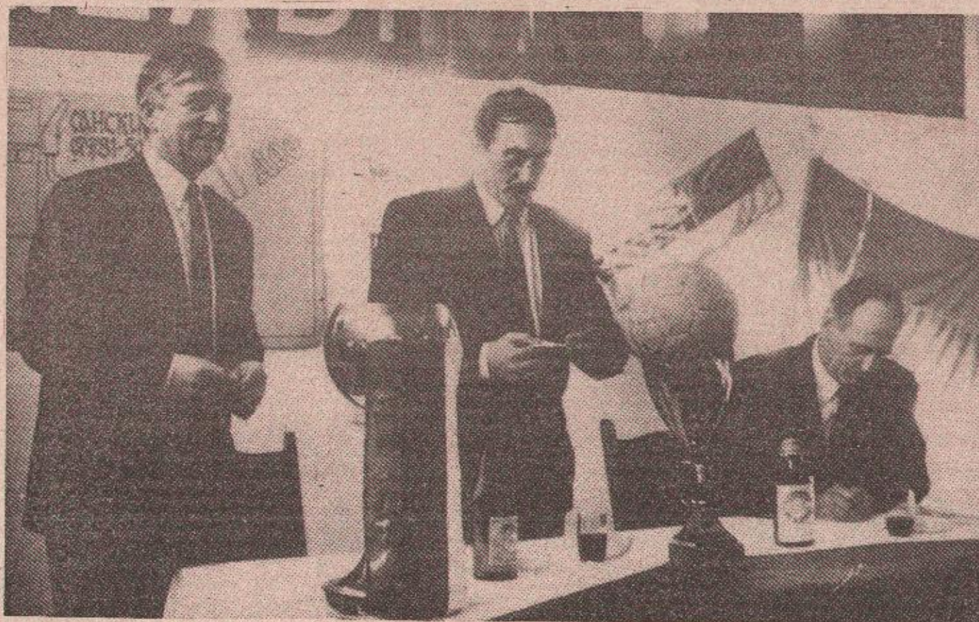
Са извлачења парова фудбалског Купа Републике Српске у хотелу „Интернационал“