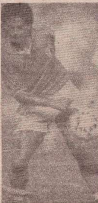
НАЈБОЉИ У 1993. ГОДИНИ: Роберто БАЂО