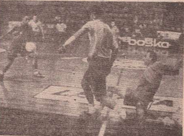
НА РЕДУ НОВА УЗБУЂЕЊА: Са турнира у малом фудбалу „Борик 94“

Руководиоци екипе Чета војне полиције Шеснаесте бригаде највише су жалбу на утакмици са Другом лакоим. У жалбу је наведено да је тим „Шеснаесте“ оштетан, јер је требало да се првенствено регулира ток меча (било је 1:1), односно да свакога првенствено по бод, а не да одлучују о томе судијери.