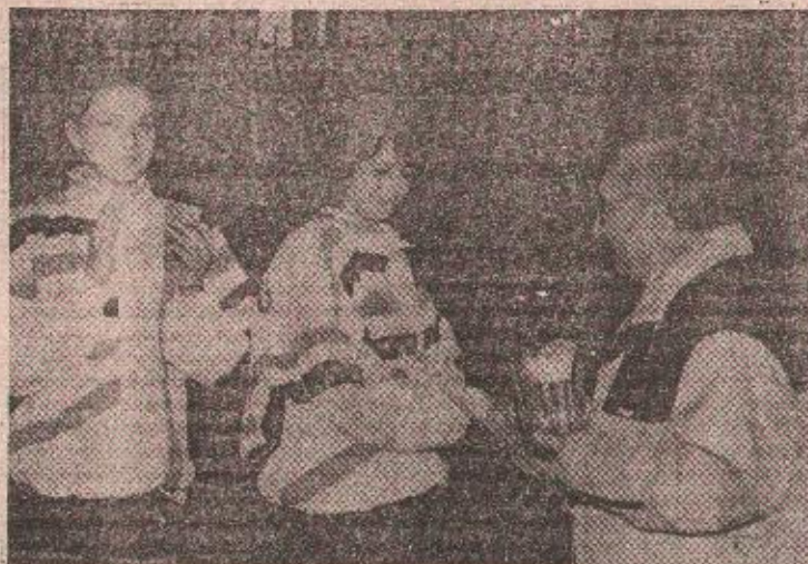
„Гласова“ иза капитену Младог Крајишника

Аутоотрнова ДТ из Бијељине поражена је, али се слободно може рећи да су екипа на коју у будућности треба озбиљно рачунати. Оптерећане пре свега име-