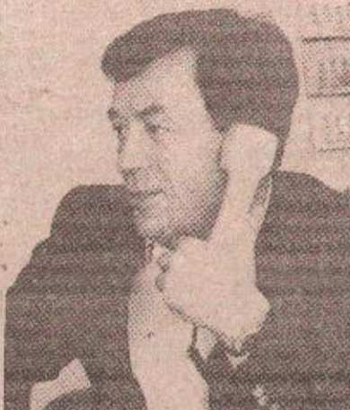
Радослав Брђанин: Ауто-путом и пругом Пет „Б“ Западна Србија се повезује с Београдом

Пруга која ће и дефинитивно повезати западне крајеве Србије