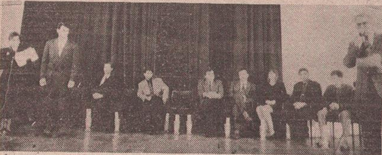
Са прошлогодишњег избора најбољих