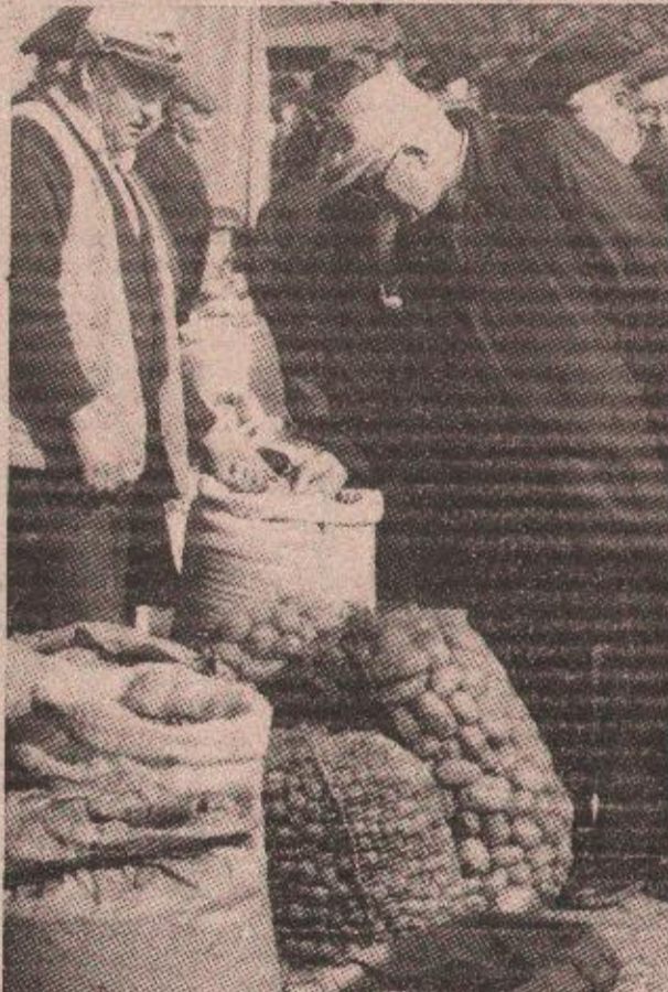
Марке путе земља и на тржници