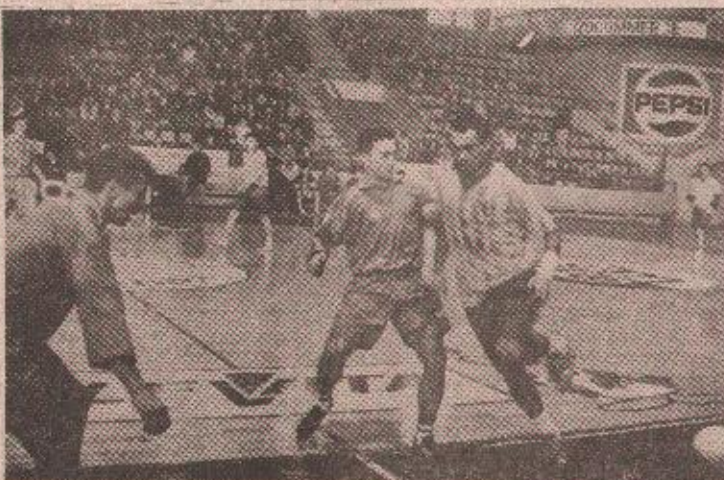
НА РЕДУ ОДЛУЧУЈУЋИ МЕЧЕВИ: Тринутак из меча Бонд - Марбел

БОНУС—КАНТУН: Веселић 7, Врањеш, Кончар 8, Стојановић 7, Балабан 7, Тодоровић 8, Џомбић 8, Чинић 7, Гушман и Ђурђић. ЧЕТА ВП 16: Аджиновић 8, Вељко Лолић 7, Кнежевић 7, Вид Лолић 7, Обрадовић 8, Рисовић 7, Толић 8, Стулар, Симић, Метвић.