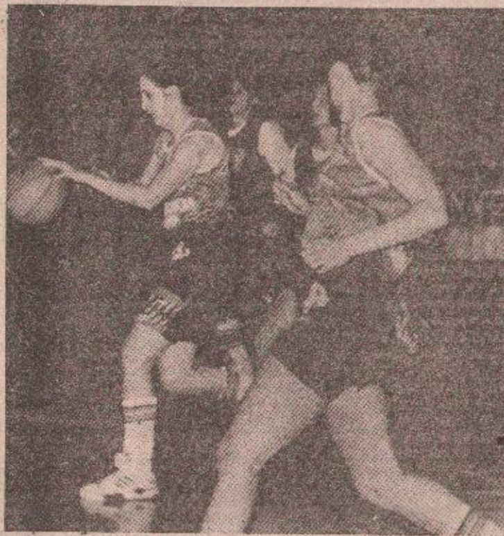
Детаљ са финалне утакмице

АУТООТРНОВА ДТ: Гајић, Милиновић 4, Скулеуновић 13 (10/7), Абдулхалић 11 (4/2), Суљановић 3 (2/1), Милованић 7 (2/1), Љупић, Солдерић 2, Симић, Милованић.