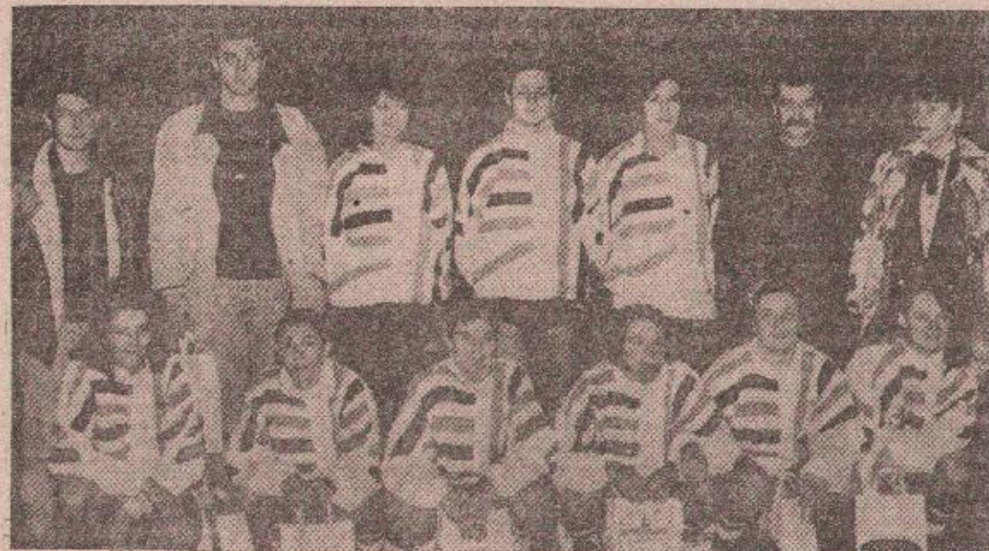
Победници првог Купа Републике Српске