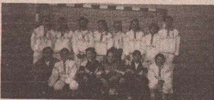
ЗАДРЖАН КОНТИНУИТЕТ У РАДУ

Поред прве екипе у клубу постоји и пионирска секција, у којој је 30 девојчица. У клубу раде три